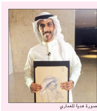
صورة هدية للعماري

أجواء راقية عاشها جمهور تلفزيون الكويت مع العماري والذي بدأ الحديث بعد تقديم تقرير جمع اصدق واجمل لقطات مرت عليه في حياته الفنية ومشواره، وغناياته التي تؤثر في قلوبنا جميعا، خصوصا ان العماري اشتهر بالتعبير الصادق من خلال كلماته والحنان وادائه الملىء بالاحساس، خصوصا التي تتناول المواضيع الاجتماعية. دار الحوار بين ايمان وحمد عن غناية «هبيه» التي تصنف حالة الاب في البيت وسط ابناؤه، وكيف يكون هو عمود البيت الذي ان وقع تغيرت الحياة. وقال حمد ان الاغنية هي وصف لحالة والسدي، الله يحفظه، عندما توفي جدي، رحمه الله، ومدى تاثره بصمت، وكيف شعرت باحساس الفقد المذهب، ليغني «هبيه»، وانطرب وسلطن وتفاعل معه كل من كان في الاستوديو. وبعد ذلك عرض تقرير تحدثت خلاله الفنانة شيخة العسلاوي، قائلة: «ما سمعت لحن حمد ما قدرت ما اخذه واغنيه، وحسينتي فيه».