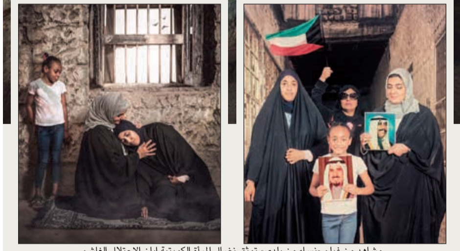
مشاهد من فيلم «نساء من بلدي» يوثق نضال المرأة الكويتية إبان الاحتلال الغاشم