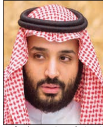
نائب خادم الحرمين الشريفين صاحب السمو الملكي الأمير محمد بن سلمان

أعلنت المملكة العربية السعودية عن مشروع تطوير منتجعات على نحو 50 جزيرة تقع قبالة سواحلها على البحر الأحمر بدعم من صندوق الاستثمارات العامة. وبحسب وكالة الأنباء السعودية (واس) سيضم مشروع «البحر الأحمر» الذي سيقام بين مدينتي أملج والوجه محمية طبيعية وأنشطة الغوص لاستكشاف الشعب المرجانية إلى جانب مواقع أثرية. وسيتم وضع حجر الأساس للمشروع في الربع الثالث من 2019 على أن تنتهي المرحلة الأولى في الربع الأخير من 2022.