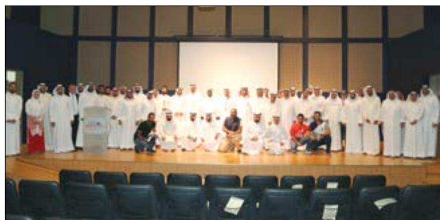
صورة جماعية للمشاركين في الدورة

اختتم معهد الأكاديمية الأسترالية للدراسات والتدريب الأهلي بالتعاون مع شركة إدارة المخاطر والاستشارات الأمنية (ريمسكو - RIMSCO) دورة دبلوم تدريب في برامج خاصة في شؤون الأمن والدفاع «الإدارة الأمنية». حيث أنشئت الأكاديمية الأسترالية لتكون شريكاً فاعلاً في الجهود الوطنية الرامية إلى الارتقاء بنوعية التعليم والتدريب وهي حريصة على توفير المعايير الدولية للتعليم والتدريب وتطوير خطته مع احتياجات سوق العمل المهني.