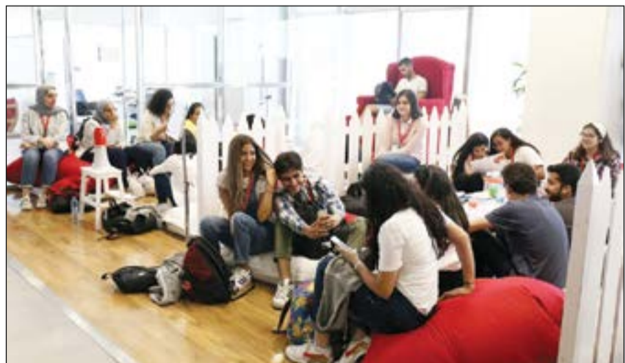
نقاشات بين مجموعات الطلبة