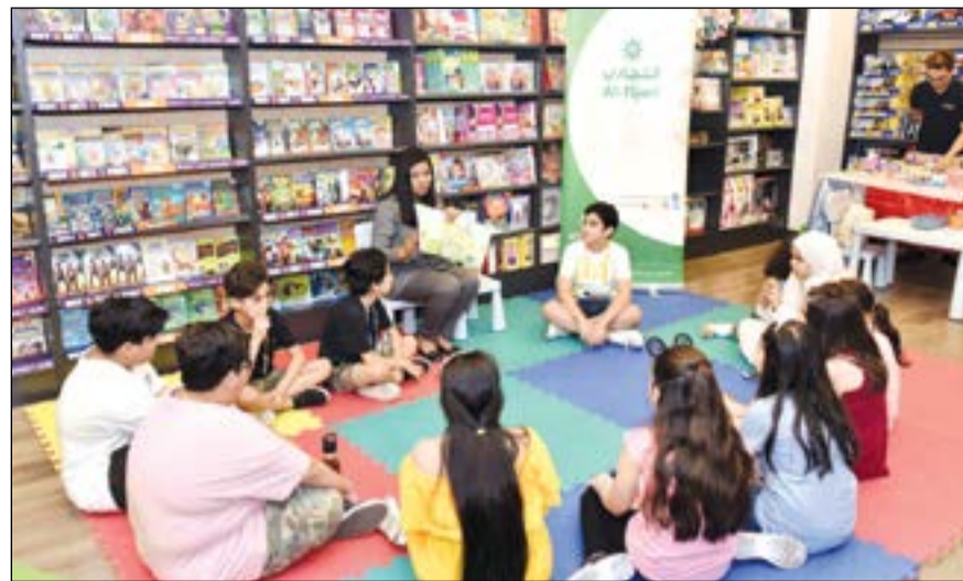
جانب من الأنشطة

أعلن البنك التجاري الكويتي عن اختتام الأسبوع الأول من الأنشطة الثقافية الممتعة الذي نظمها البنك مع مكتبة ذات السلاسل حصرياً لعملاء حسابي الأول من عمر 5 إلى 14 سنة في فرع المكتبة الواقع في مجمع الأقبوز. وهدفت هذه الأنشطة إلى تشجيع الأطفال على ممارسة القراءة وإبراز أهميتها ودورها في تطوير ثقافة الطفل ومعرفة.