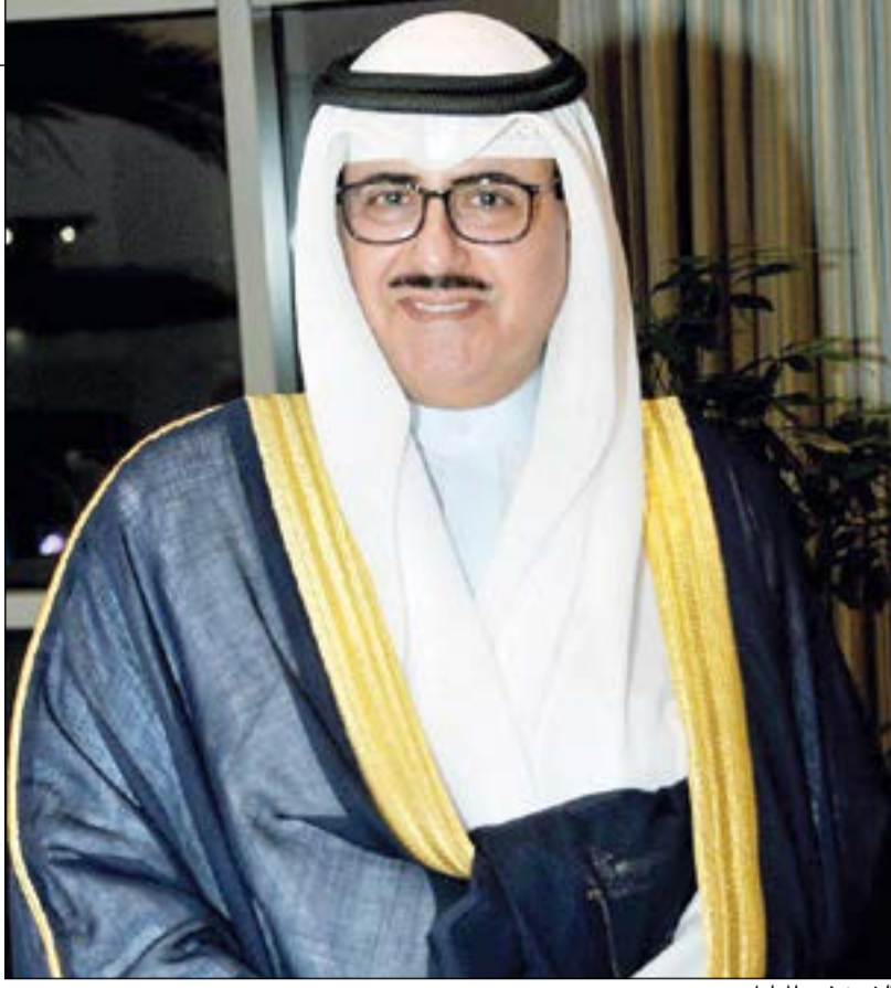
الشيخ فهد المبارك