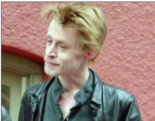
بطل هوم الوون