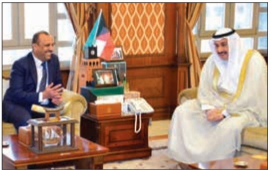
الشيخ فيصل الحمود مستقبلاً محافظ النجف

الشقيقتين. وفي نهاية اللقاء وجه محافظ النجف دعوة إلى الشيخ فيصل الحمود لزيارة النجف الأشرف، الذي شكره على دعوته.