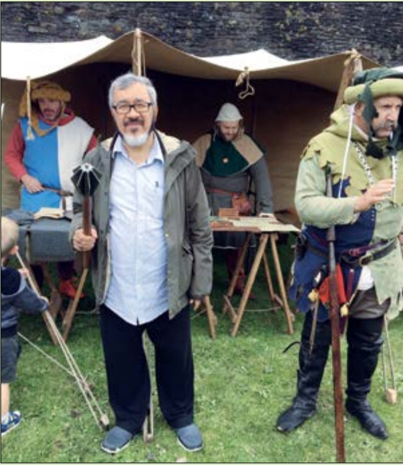
مع محاربيهم الويلزيين