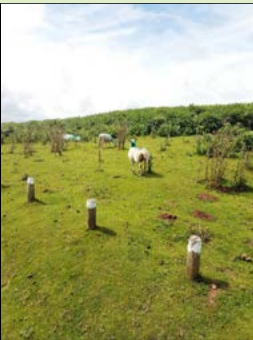
خرافهم سميحة لوجود العلف الرباني