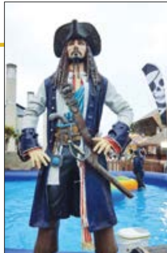
ويلز تهتم بالباطل

وتملك ويلز سواحل خلابة وبحيرات وأنهاراً وقلاعاً كما ان في الشمال تلالاً خضراء وفي الجنوب سواحل تملك مياهاً ذهبية وسواحل رملية ويتميز ميناء ويلز بالعصرية ومبنى البلدية. وما يلفت نظر الزائر الذي يذهب الى ريفها بذهل من حجم مرتفعاتها ومرورها الشاسعة والشلالات والبحيرات والمنحدرات