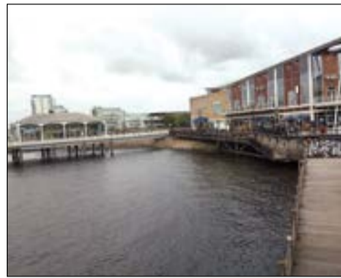
منظر كالكولج الرسومة