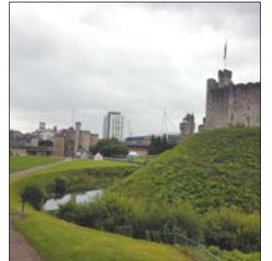
هنا التاريخ يعرض نفسه «قلعة ويلز»

سيلوريس في الشمال الغربي والرومان في الجنوب واعتمدوا سابقاً على التنقيب عن الذهب كمصدر للرزق، وهي اول من استخدم القطار البخاري.