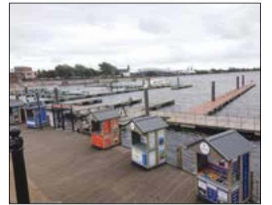
البحيرة الزرقاء متعة وجمال أخذ يسر الناظرين