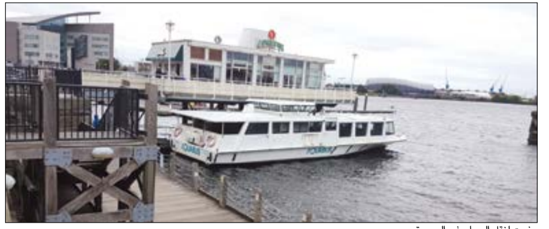
يخوت لنقل السياح في البحيرة