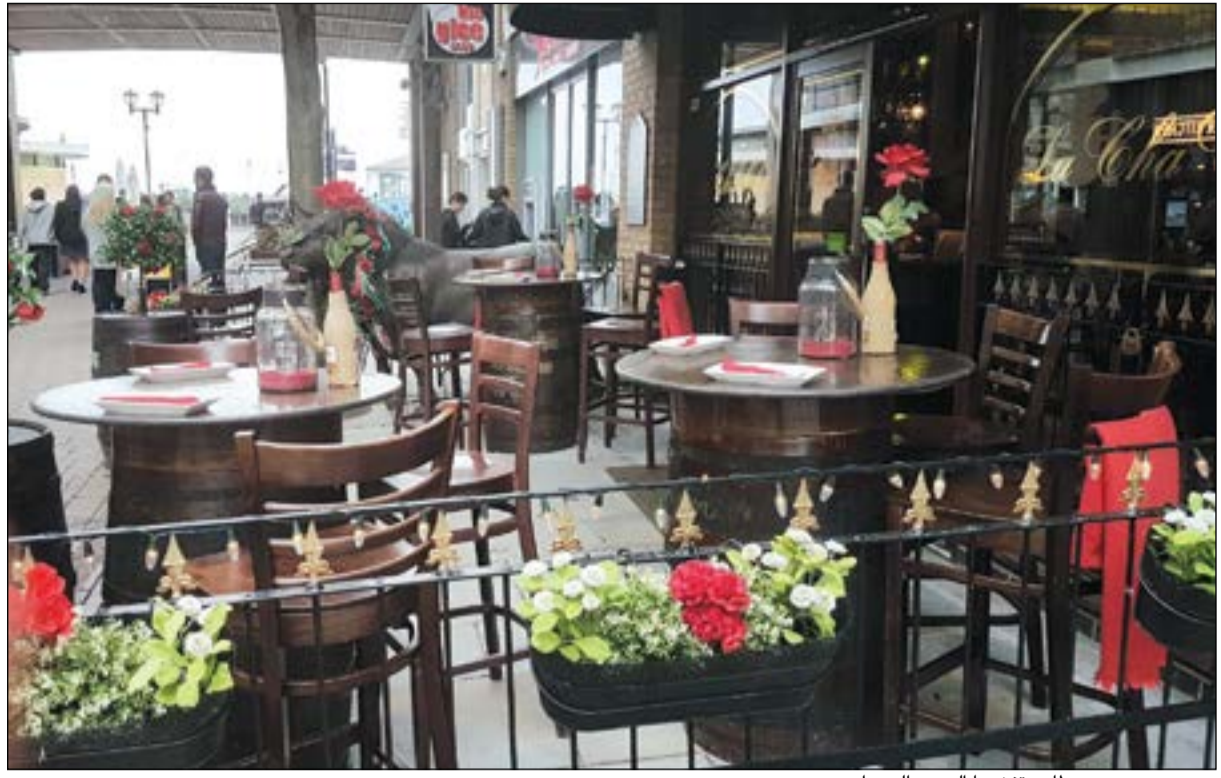
مطاعم تغزوها الورد الحمراء