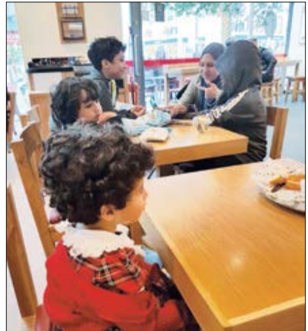
مجموعة من الأطفال الكويتيين يتناولون الإفطار