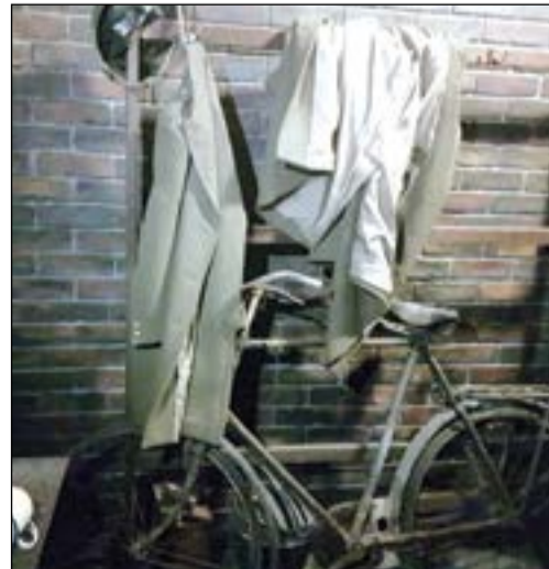
بغايا اترهم في القلعة