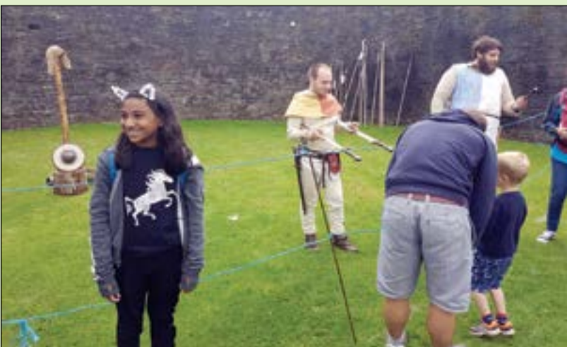
كوبيتة صغيرة تشاهد المحاربين الويلزيين

لحبي المتاحف يتوافر في ويلز متحف وجاليري ويلز الوطني، ويتميز بموقعه في العاصمة كارديف وايضا بمعرضاته الفنية والعلمية الفريدة في نوعها واشكالها في عموم بريطانيا، كما ان القطع الأثرية المعروضة في المتحف لها دلالتها التاريخية والمعلوماتية، اضافة الى اللوحات المعاصرة والدخول مجانا.