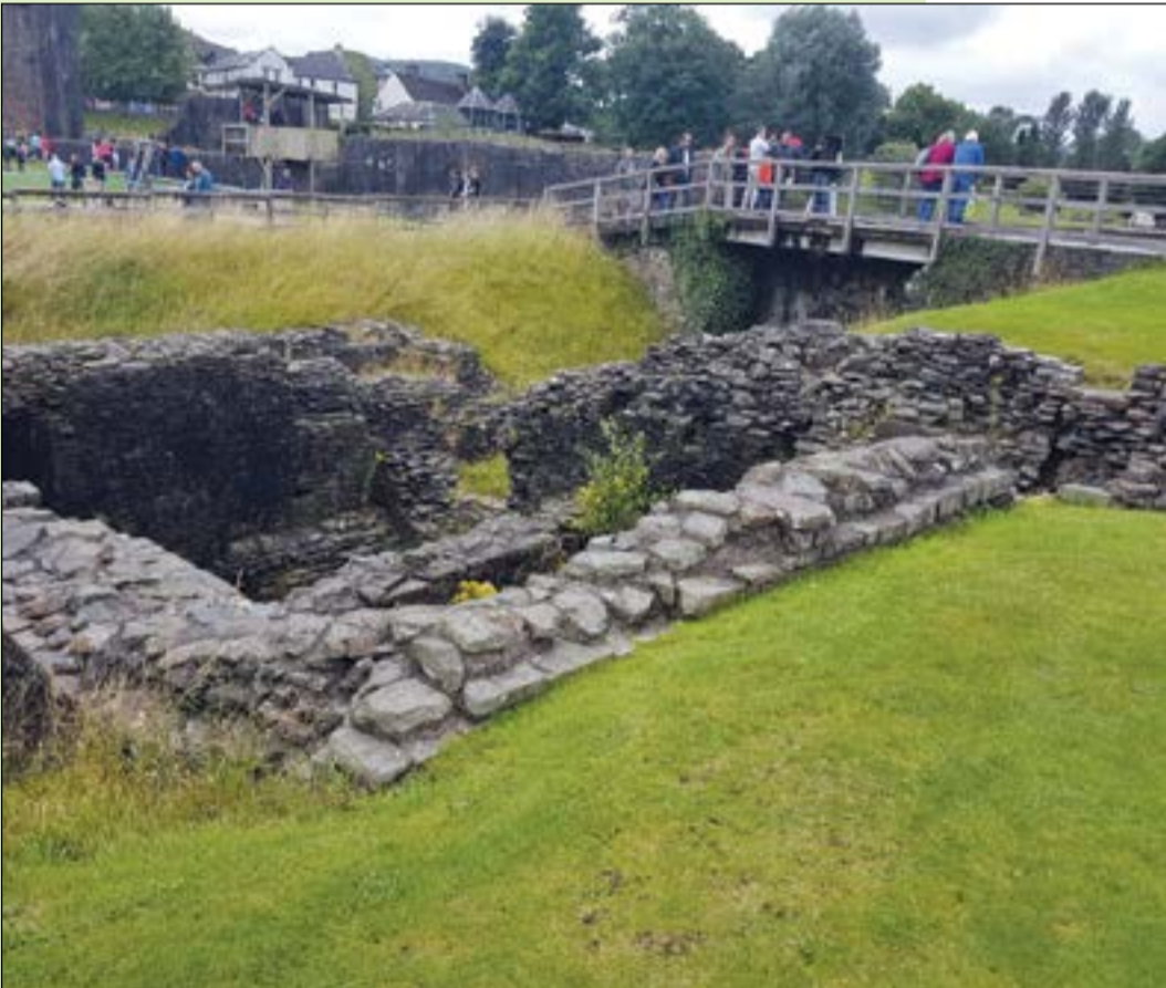
آثارهم باقية ويقفل عليها السياح من كل مكان