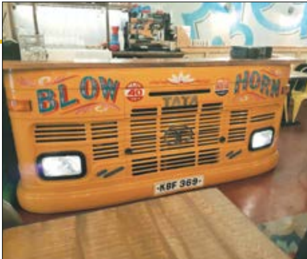
واجهة مطعم مقدمة باص لاديسويها كويتى قالوا يتقلص