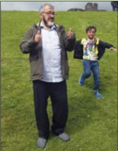
يوسف الجد يسبق يوسف الحفيد وكلاهما فائز