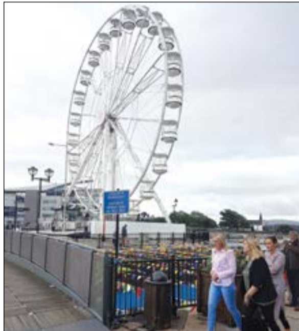
المراجيح الدائرية متعة