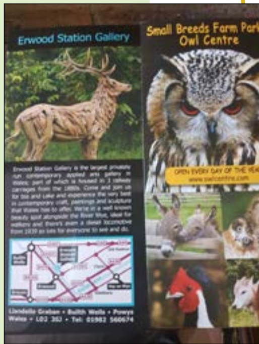
حيوانات الريف الويلزي

المملكة المتحدة التي تعتمد على نشيد «ليحفظ الرب المملكة» نشيدا وطنيا لها.