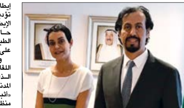
السفير الشيخ علي الخالد مع نادية خديدي

إيطاليا بالدور «الحيوي» الذي تؤديه هيئة الحماية المدنية الإيطالية في التعامل مع مختلف حالات الطوارئ والكوارث الطبيعية التي شهدتها إيطاليا على مدى أربعة عقود. وأعرب السفير الخالد خلال اللقاء عن تقديره البالغ للدور الذي تؤديه هيئة الحماية المدنية في إيطاليا، مؤكداً أنها «أثبتت تميزاً دولياً بفضل منظومة العمل وهيكلية الإدارة والتدخل السريع وكذلك بوجود خبرات وإمكانيات مميزة».