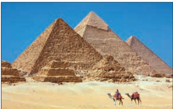
الهرم الأكبر في المتحف وبقايا الكسوة ظاهرة

يغمر شمال أفريقيا ومصر خلال العصر الجيولوجي المعروف Cenozoic منذ حوالي 66 مليون عام. والحجر الجيري مكون من البلورات الكربونات الكلسيوم التي تعطي قوة المكونات البحرية الصلبة كالماراجان الذي لا يذوب في الماء إلا على مدى آلاف الملايين من السنين!