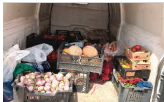
الخضراوات والفواكه التي تمت مصادرتها