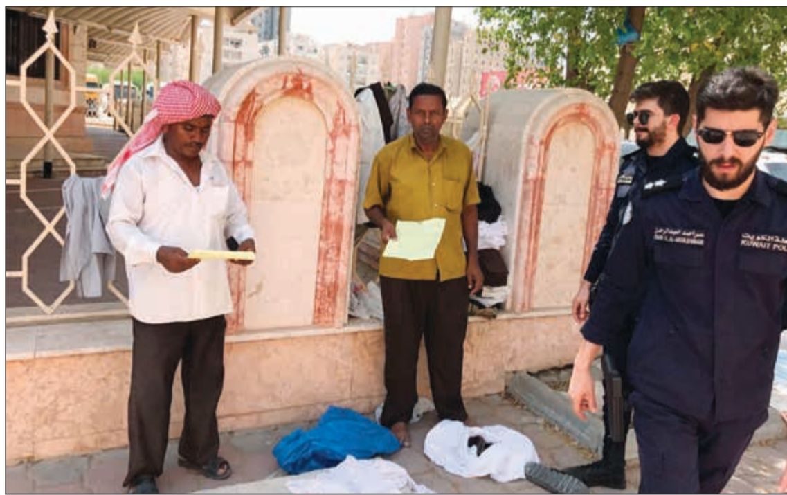
رجال الأمن يحررون المخالفات بحق الباعة الجائلين

«أم ثلاثينية تسير في الطريق مع ابنتها، من منطقة الى أخرى، فجأة تقف بجوارهما مركبة، يدعوها صاحبها للركوب، الا انهما ترفضان فيضطر الى تصعيدهما المركبة بالقوة، وتكررت محاولات الطفلة ذات السنوات العشر