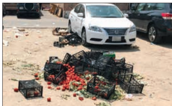
خضراوات تالفة غير صالحة للاستهلاك الآدمي