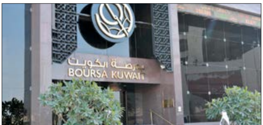
نمو أرباح النصف الأول قاد مؤشرات وسيولة البورصة للارتفاع

مليار دينار. وأنهت المؤشرات تعاملاتها الأسبوعية على النحو التالي: ● ارتفع مؤشر السوق العام بنسبة 0,4%، محققاً 24 نقطة مكاسب ليصل المؤشر إلى 6805 نقاط، بمكاسب سنوية 18,4%. ● حقق المؤشر الوزني مكاسب بنسبة 2,4% بتحقيق 10 نقاط، مكاسب ليصل إلى 417 نقطة، بذلك تصل مكاسبه منذ بداية العام إلى 9,8%. ● ارتفع مؤشر كويت 15 مكاسب بنسبة 2,5%، مضيفاً 23 نقطة لمكاسبه السابقة ليصل إلى 954 نقطة، ليزيد مكاسبه السنوية إلى 7,8%.