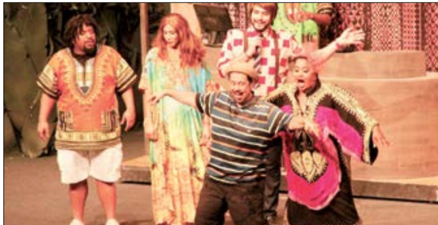
هيا الشعبي وعبدالعزيز المسلم في مشهد من «جنوب أفريقيا»

من جانبها، عبرت بطله العمل النجمة هيا الشعبي عن سعادتها الغامرة بعد العروض المتتالية التي قدمتها «جنوب أفريقيا» طوال الفترة الماضية، والتي حققت حضوراً جماهيرياً كبيراً وخليجياً لافتاً، مؤكدة اعتزازها بالوقوف إلى جانب الفنان القدير عبدالعزيز المسلم