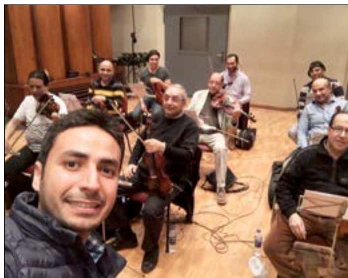
«وسيلفي» مع فرقة الموسيقى