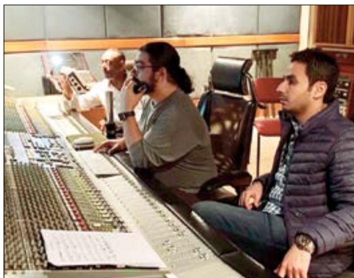
الموسيقي إبراهيم شامل يتابع مشاريعه الموسيقية

منذ ثلاث سنوات ان أنتقي ما أقدمه في مصر لأنني اضطررت في بداية حياتي إلى أن أقوم بكتابة موسيقى لأعمال فنية غير مضمرة مثل أي شاب في البداية يريد دخول الوسط، وحالياً وبعد أن استطعت تحقيق نجاح في الوسط الخليجي قررت الانتعاش وانتظار الفرصة المناسبة التي تضعني في الصف الاول من المنافسة.