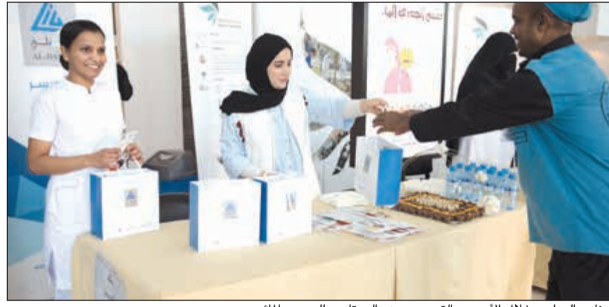
جناح «الدولي» خلال الأسبوع التوعوي عن «الروتا» و«الجدري المائي»

على تطوير برامجها الوقائية والعلاجية، معتبراً أن اعتماد هذه التطعيمات الجديدة يحمي أطفالنا ويمنح الفرصة أمام كل طفل لكي يستمتع بالصحة خلال مراحل حياته بفضل الاهتمام بالرعاية الصحية منذ الولادة.