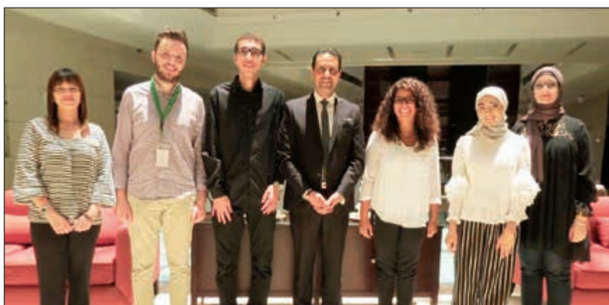
لقطة تذكارية مع متدربي «لويك»

وخلق فرص داعمة لهم، وتمنى للجميع النجاح والتوفيق فيما يتعلق بدراساتهم وخططهم المستقبلية وعبر عن ترحيبه الدائم بجميع المتدربين على اختلاف تخصصاتهم.