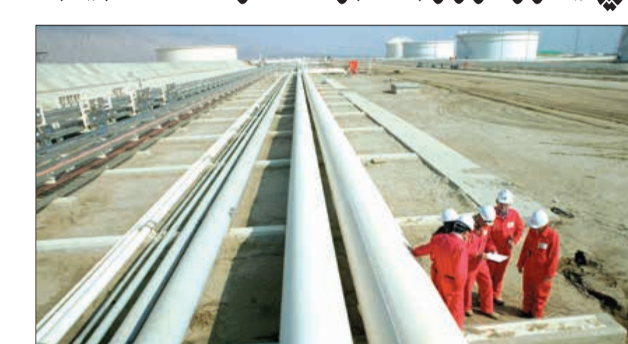
أحد خطوط نقل النفط الخام في أوروبا

وذكرت المصادر ان الكويت تركز حاليا على أسواق بريطانيا وفرنسا وهولندا وألمانيا من خلال تواجد شركة البترول العالمية الكويتية Ipi. وقالت انه على الرغم من التكلفة المرتفعة لمد خطوط الأنابيب إلا أنها أسرع وأرخص في التشغيل والصيانة، وتعتمد على تفعيل ضغط عال في بداية الخط لضمان تدفق المادة النفطية أو مشتقاتها. ويعد خط أنابيب «الصدقة» الروسي الأطول عالميا بامتداده أربعة آلاف كيلومتر ووصله إلى جمهورية التشيك، ألمانيا،