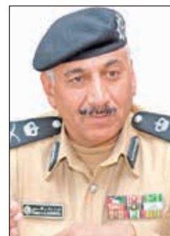
اللواء فهد الشويح

الحوادث المرورية منذ عام 2012 حتى شهر ابريل عام 2017 (917,447). وفي عام 2012 بلغت الحوادث المرورية 86271، وفي عام 2013 بلغت 89527، وفي عام 2014 بلغت 99047، وفي عام 2015 بلغ 77961، وفي عام 2016 بلغت 71582. وفي عام 2017 بلغت 23529، بينما بلغت حالات الوفيات الناتجة عن الحوادث المرورية 2366 حالة وفاة خلال