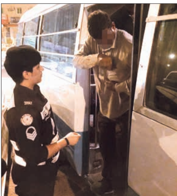
لحد المطلوبين يصعد الباص