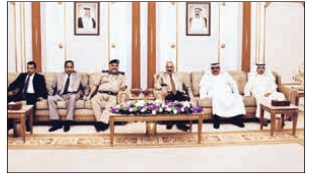
قيادات «الداخلية» في استقبال الفريق محمود الدوسري لدى عودته

عاد وكيل وزارة الداخلية الفريق محمود الدوسري والوفد المرافق له إلى البلاد مساء أول من أمس الأحد بعد زيارة رسمية إلى الجمهورية الفرنسية دشن خلالها أولى الطائرات العمودية (هليكوبتر) التي ستسلم إلى الوزارة من الطائرات الأربع التي تم التعاقد على شرائها بين الداخلية وشركة إيرباص، وذلك في إطار الرؤية الاستراتيجية للوزارة التي اعتمدها نائب رئيس مجلس الوزراء وزير الداخلية الشيخ خالد الجراح، لتحديث جميع قطاعاتها.