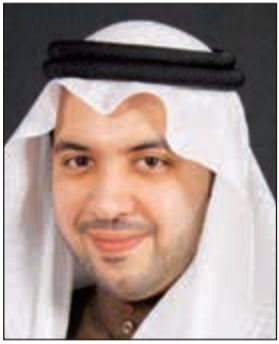
الشيخ مبارك العبدالله

أعلنت شركة القرين لصناعة الكيماويات البترولية أمس عن تحقيق صافي ربح بقيمة 6,17 ملايين دينار خلال الربع الأول المنتهي في 30 يونيو 2017 من السنة المالية 2017/2018، بارتفاع 24% مقابل 4,98 ملايين دينار خلال نفس الفترة من العام الماضي. وبلغت ربحية السهم الواحد خلال ذات الفترة من السنة المالية مبلغ 5,93 فلوس بالمقارنة مع 4,79 فلوس خلال نفس الفترة من العام الماضي. وسجل مجمل الربح المجمع ارتفاعاً بنسبة 11% ليصل إلى 18,60 مليون دينار بالمقارنة مع نفس الفترة من العام الماضي نظراً لارتفاع مبيعات