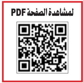
لمشاهدة الصفحة PDF

6 ملايين دينار أرباح «القرين» في الربع الأول بنمو 24٪