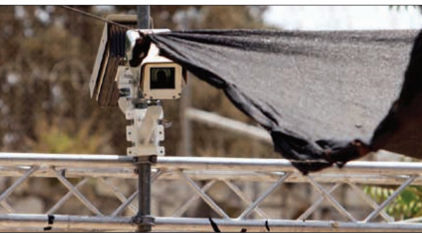
كاميرات جديدة قام الاحتلال بتثبيتها في محيط المسجد الأقصى امس

ألمح لإمكانية تقليل استخدام البوابات.. واجتماع طارئ لـ «الوزاري العربي» الخميس المقبل الاحتلال يصعد استفزازاته ويحيط «الأقصى» بكاميرات مراقبة