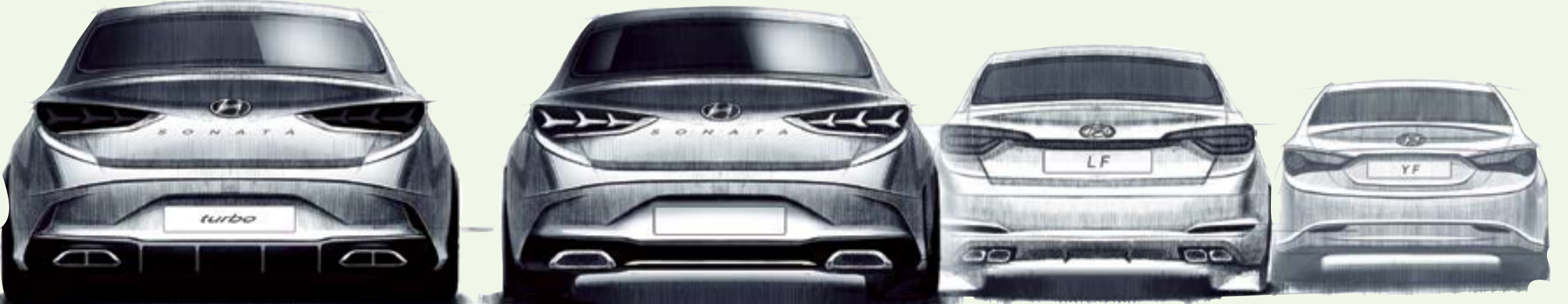
التعديلات التي نالها التصميم الخلفي تبرز المظهر الواثق للسيارة

تعتزم هيونداي إطلاق سيارتها سوناتا متوسطة الحجم في أفريقيا والشرق الأوسط الشهر المقبل بعد أن خضعت لعملية تجديد تجميلية أكسبتها تغييرات دراماتيكية واضحة في جسمها، وفق صور أولية عرضتها الشركة. ومن شأن الألواح والصفائح المعدنية والحواف الجديدة أن تجعل سيارة الجيل الحالي من سوناتا متماشية مع أسلوب التصميم المتطور المعلقة صناعة السيارات الكورية، الذي بات يضي بالتدرج