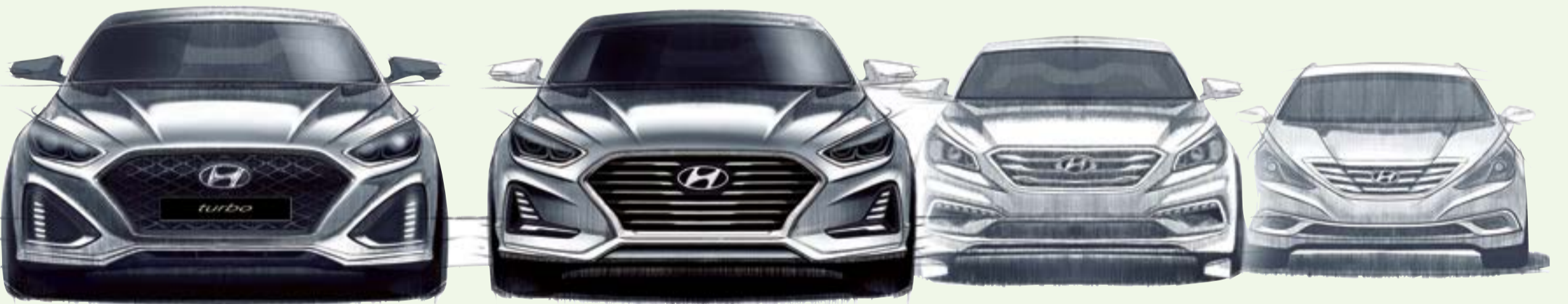
الشبك الأمامي متوالي الانحدار يرسم مظهرا أكثر ريقا وحضورا

المصد، في حين أضيف شعار سوناتا كبير الحجم إلى مركز غطاء الصندوق، ما يبرز المظهر الواثق للسيارة. وأشار سونغ إلى أن طراز سوناتا الحالي حقق نجاحا كبيرا في أوساط المشترين، لكنه انتهى إلى تأكيد أن التصميم المحسن المتسم بالجرأة والتميز للطراز المرتقب يحافظ على العناصر التي أسست نجاح طراز سوناتا الحالي، بينما يأتي كذلك بحزمة أكثر حداثة وفخامة من المزيا.