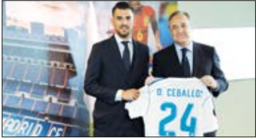
أهلا بك في الريال

انضم النجم الإسباني داني سيبايوس رسمياً للفريق الملكي ريال مدريد في مكاتب البرتايبو، حيث وقع على عقد مدته ستة مواسم سيربطه بالفريق حتى يونيو عام 2023 وبشرط جزائي قيمته 500 مليون يورو. وأعرب سيبايوس عن سعادته بتوقيع عقده وطموحه لتحقيق الكثير من الألقاب مع بطل الليغا ودوري الأبطال.