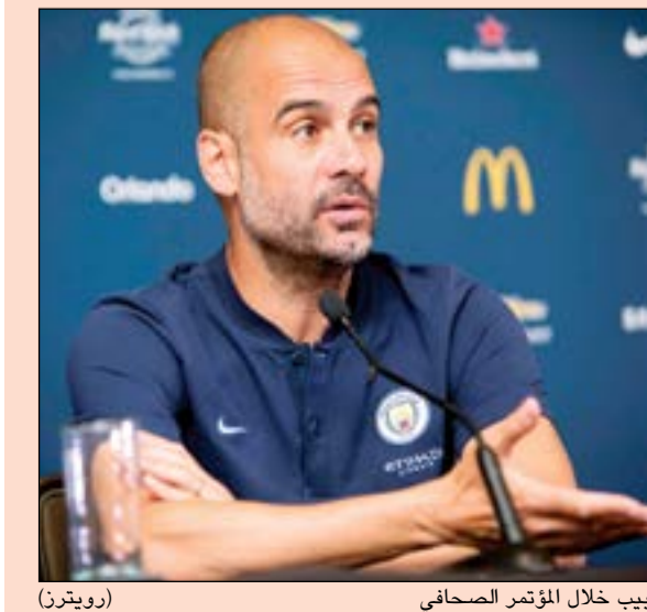
بيب خلال المؤتمر الصحافي