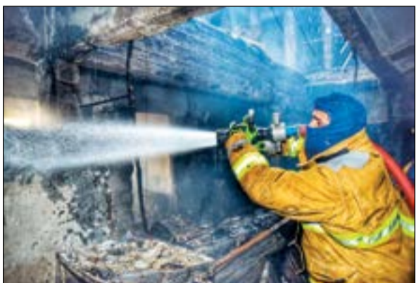
رجل إطفاء يتعامل مع السنة اللهب