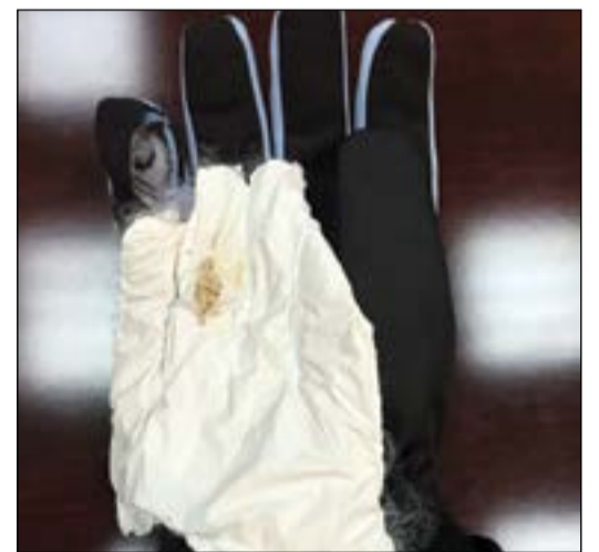
الهيريون اخفي بطريقة احترافية في قفازات