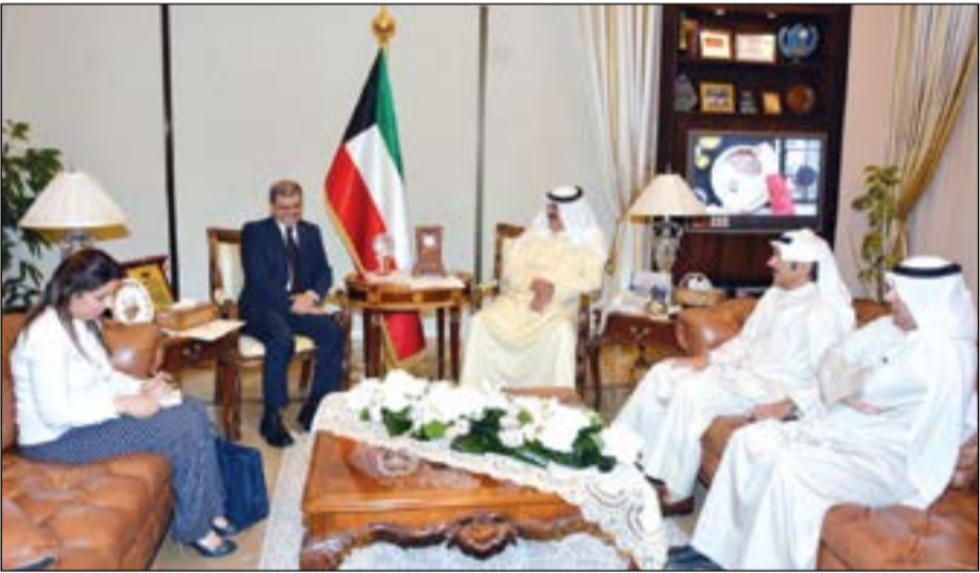
خالد الجارالله مستقبلاً سفير العراق علاء الهاشمي

حيث تم خلال اللقاء بحث عدد من أوجه العلاقات الثنائية بين البلدين إضافة إلى تطورات الأوضاع على الساحتين الإقليمية والدولية. حضر اللقاء مساعد وزير الخارجية لشؤون مكتب نائب الوزير السفير ايهم العمر ومساعد وزير الخارجية لشؤون الوطن العربي السفير عزيز الديحاني.