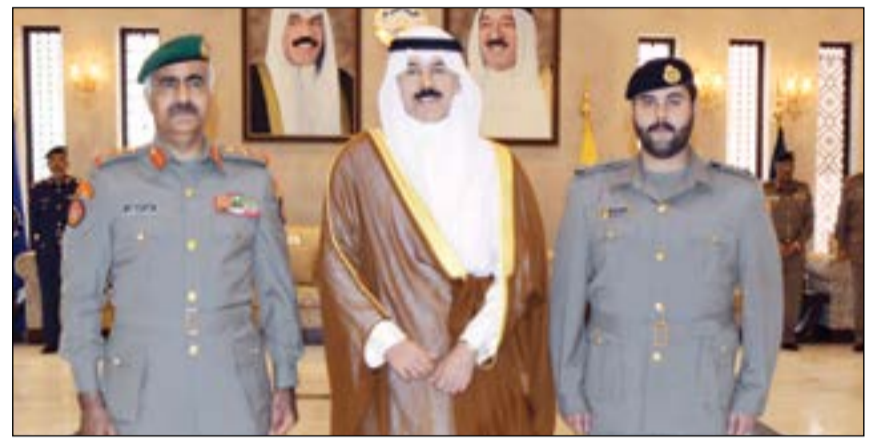
الشيخ محمد الخالد والفريق الركن محمد الخضر والأول على الطلبة الكويتيين

بحث رئيس الأركان العامة للجيش الكويتي الفريق الركن محمد الخضر أمس الخميس مع الملحق العسكري للمملكة الأردنية الهاشمية الشقيقة لدى البلاد العميد الركن محمد السحيم أوجه التعاون المشترك. وقالت وزارة الدفاع في بيان لها ان اللقاء تطرق إلى بحث العديد من الموضوعات ذات الاهتمام المشترك ولاسيما المتعلقة بالجوانب العسكرية وسبل تطويرها وتعزيزها بين البلدين الشقيقين.