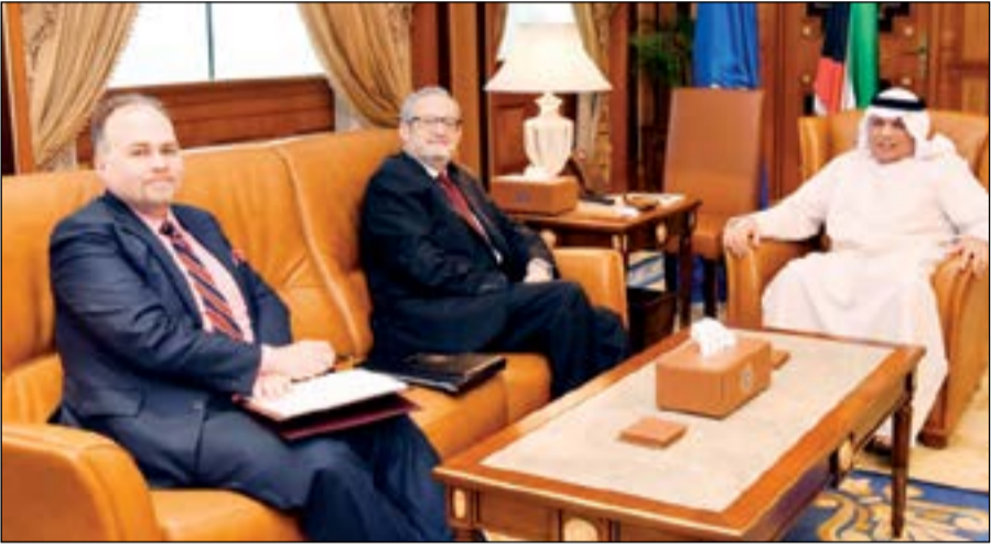
الشيخ خالد الجراح مستقبلاً السفير الأميركي لورانس سيلفرمان

بحث نائب رئيس مجلس الوزراء وزير الداخلية الشيخ خالد الجراح مع سفير الولايات المتحدة الأميركية لدى الكويت لورانس روبرت سيلفرمان أمس الخميس موضوعات ذات اهتمام مشترك. وذكرت الإدارة العامة للعلاقات والإعلام الأمني في بيان صحفي أن الوزير الجراح أكد