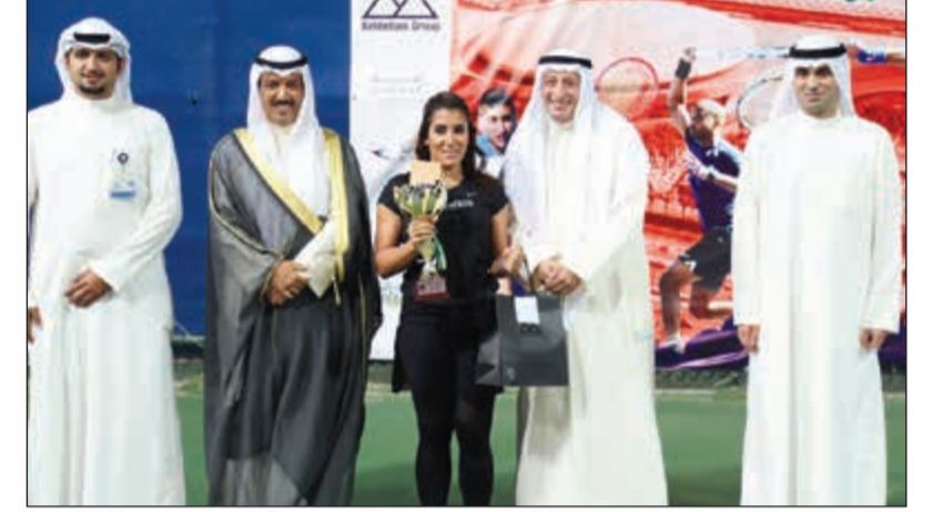
.. وشهادة في اللعبة