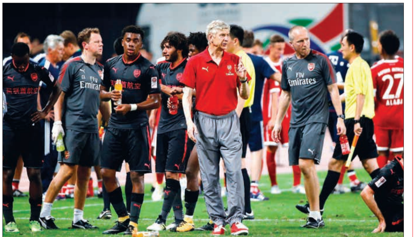
مدرب أرسنال فرحان بالثور على بايرن ميونخ في الصين

سيرتفع عدد المنتخبات المنافسة في نهائيات كأس أمم أفريقيا لكرة القدم إلى 24 فريقا، وستتغير توقيت البطولة لتقام في يونيو ويوليو، لكن ستستمر إقامتها كل عامين طبقا لتوصيات حول شكل البطولة طرحت خلال مؤتمر في المغرب. وجاءت التوصيات خلال ورشة عمل ناقشت