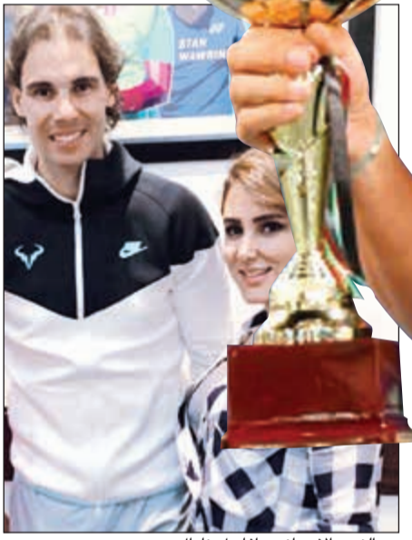
مع النجم الإسباني رافاييل نادال