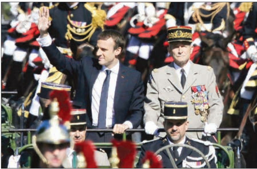
الرئيس الفرنسي إيمانويل ماكرون بصحبة رئيس الأركان المستقيل الجنرال بيار دو فيليب قبل أيام

باريس - وكالات: يواجه الرئيس الفرنسي إيمانويل ماكرون أول أزمة سياسية منذ توليه الرئاسة، بإعلان رئيس أركان الجيوش الفرنسية بيار دو فيليب استقالته من منصبه، بعد خلاف مع ماكرون حول تخفيض ميزانية الدفاع. وكتب الجنرال دو فيليب في بيان «في الظروف الحالية، لا اعتقد أنني قادر على الحفاظ على استمرارية نموذج الجيش الذي أؤمن به لضمان حماية فرنسا والفرنسيين». وقد أعلنت الحكومة ان الجنرال فرنسوا لوكوانتر المستشار العسكري لرئيس الوزراء سيتولى رئاسة أركان الجيوش الفرنسية خلفا لدو فيليب. وتهدد مسألة بقاء رئيس الأركان في منصبه منذ أيام في الأوساط العسكرية بعد مواجهات حادة بين الرجلين. ويأخذ عليه رئيس الدولة خصوصا انتقاداته لـ «إقتطاعات معلنة في ميزانية الجيش بقيمة 850 مليون يورو للعام الحالي في إطار تقشف شامل في موازنة الدولة مع خفض متوقع بـ 4,5 مليارات يورو من نفقات الدولة في 2017. وبعد ان ويخج ماكرون الجنرال أمام عسكريين عشية العيد الوطني في 14 يوليو بتأكيده «أنا رئيسك»، وانتقاده طرح النقاش حول الميزانية «بطريقة غير لائقة على الملأ» دون ان يسمي رئيس الأركان. وفي ضربة أخيرة، لم يستبعد ماكرون ان يسحب ثقته من فيليب.