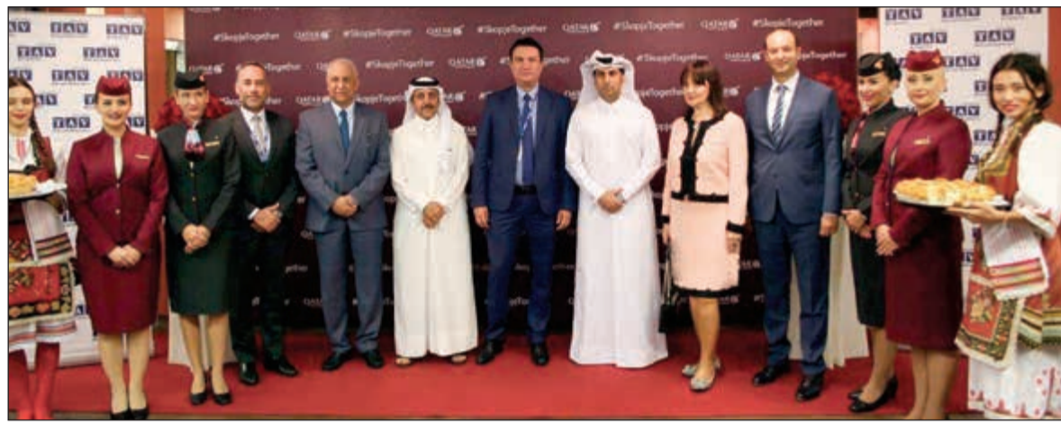
جانب من استقبال وفد «القطرية» في مطار الاسكندر الأكبر