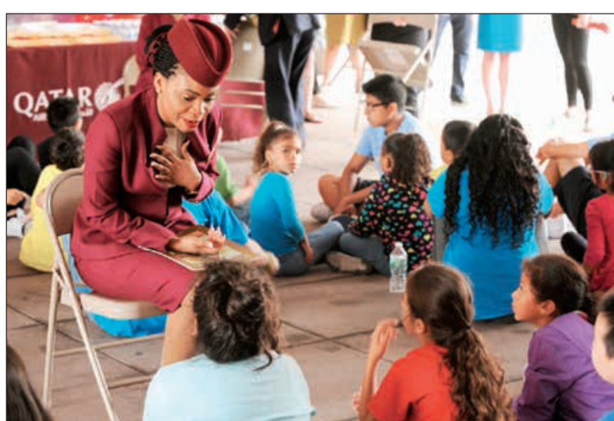
طاقم الضيافة قام بتوزيع الكتب وقراءتها لما يقارب 100 طفل

إلهام لهؤلاء الطلاب ليكنوا عنصراً فعالاً في مجتمعاتهم مستقبلاً. ومن أجل دعم المبادرة ونشرها بين المجتمع في مدينة نيويورك، حضر أفراد من طاقم الضيافة الشهر للخطوط الجوية القطرية الحدث الذي أقيم في بروكلين يوم الجمعة الماضي، حيث قاموا بتوزيع الكتب وقراءتها لما يقارب 100 طفل، ومشاركة خبراتهم حول العيش في الخارج، وتعريفهم بقيمة التعليم والسفر. وتتماشى المبادرة مع التزام «القطرية» المستمر بتعليم الأطفال من خلال برنامج «علم طفلاً». وتواصل دعم المجتمعات التي تقدم خدماتها فيها من خلال برامج تهدف إلى زرع حب الاستكشاف من خلال القراءة والسفر.