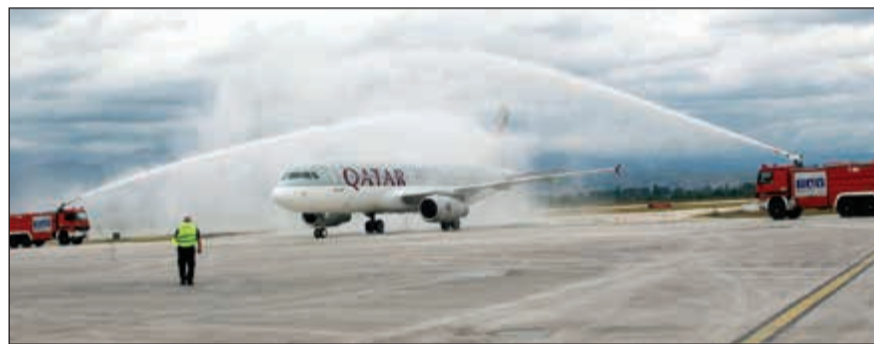
استقبال الرحلة الافتتاحية للناقلة بممرشات المياه

مع أكثر من 150 وجهة مميزة في شتى أرجاء العالم. وتعتبر مقدونيا مركزاً لصناعات معالجة المعادن والكيماويات والأخشاب والنسيج والجلود والطباعة، وتأتي ضمن قائمة أفضل عشر اقتصادات في العالم في مجال الأعمال. وسيشهد إطلاق الخط الجديد إلى سكوبيه على متن الخطوط الجوية القطرية الحائزة على عدة جوائز في مساعدة رجال الأعمال من مقدونيا على التواصل مع شركاء الأعمال في أكثر من 150 وجهة في مختلف أنحاء العالم. وبالإضافة إلى ما سبق، توفر الرحلات الجديدة إلى سكوبيه مساحة من الشحن من شأنها تعزيز نمو التجارة جواً في جمهورية مقدونيا، وذلك من خلال ربط البلاد مع كبار المستوردين في شمال شرق آسيا عبر مقر عمليات الناقلات القطرية في الدوحة. وستتيح رحلات الخطوط الجوية القطرية من وإلى مقدونيا الفرصة أمام السياح المقدونيين لضمان وصول سهل إلى أستراليا، التي يعيش فيها أكثر من 200000 مواطن أسترالي من أصول مقدونية.