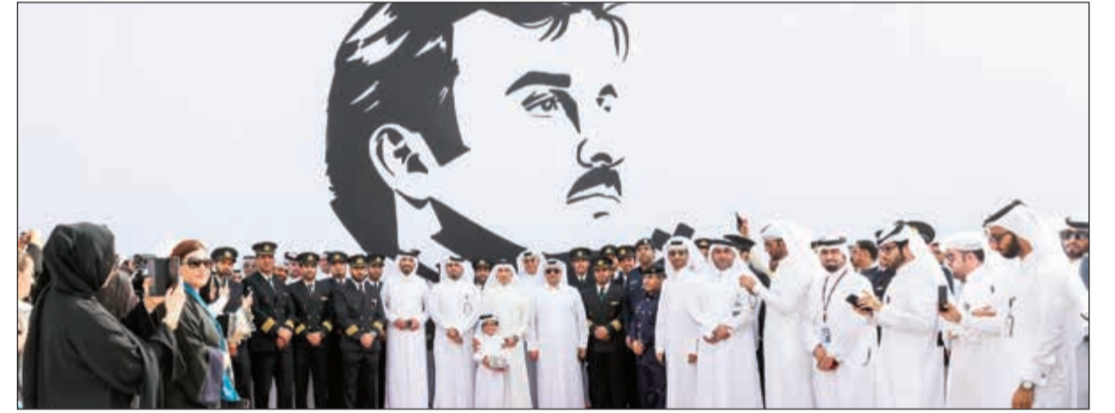
فريق عمل «القطرية» أمام الجدارية

وستستمر في التحليل عاليا في السماء وستستمر في التأكيد على شعارنا معا إلى كل مكان.