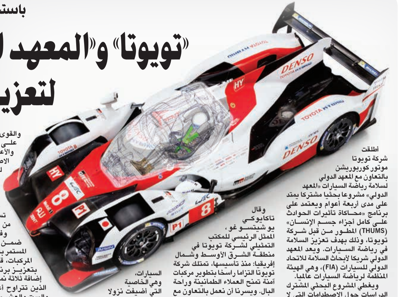
أطلقت شركة تويوتا

وفي العام الماضي ضمن إطار التزامها المستمر بالارتقاء بإداء سلامة المركبات، قامت شركة تويوتا بتعزيز برنامج THUMS عبر إضافة ثلاثة نماذج جديدة للأطفال الذين تتراوح أعمارهم بين الثلاث والست والعشر سنوات إلى الإصدار رقم 4 من برنامج THUMS. إذ تأخذ هذه المجموعة الموسعة بعين الاعتبار تأثير عملي العمر وبنية الجسم، ما يسمح بتحليل أكثر شمولاً للإصابات. وتجدر الإشارة إلى أن برنامج THUMS يستخدم مجموعة واسعة من الأغراض من قبل مصنعي المركبات وقطع الغيار، وكذلك لأغراض الأبحاث في الجامعات داخل اليابان وخارجها. ولا يقتصر استخدامه على نطاق واسع في الأبحاث المتعلقة بتكنولوجيا السلامة من قبل شركة تويوتا فحسب، بل أيضاً من قبل المؤسسات حول العالم. ويتمثل هدف جميع الأطراف المعنية في قطاع المركبات في المضي قدماً نحو رفع مستوى السلامة على الطرقات وخفض الإصابات والوفيات الناجمة عن حوادث المركبات إلى الحد الأدنى.