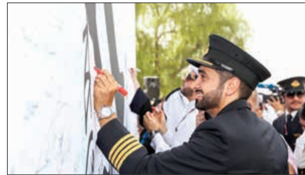
موظفو «القطرية» شاركوا في الفعالية

أكدت الخطوط الجوية القطرية دعمها وولاءها وانتماءها المتواصل لدولة قطر بتدشين جدارية ضخمة بن حمد آل ثاني أمير البلاد وشعار تميم المجد.