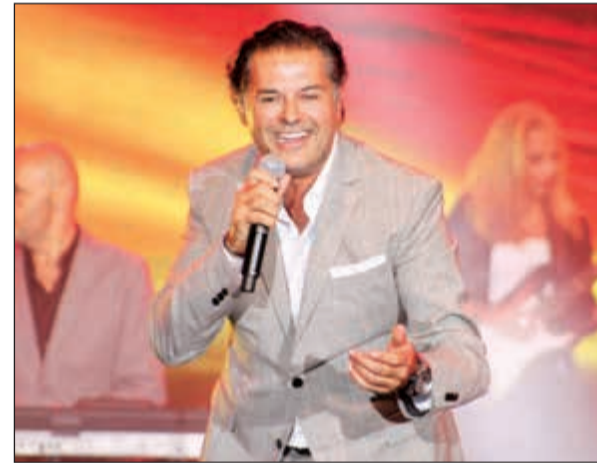
راغب علامة أثناء الحفل

أشعل الفنان راغب علامة، مساء الأحد الماضي، أجواء «مهرجانات زحلة الدولية» في لبنان بصوته وحضوره المحبين وأغنياته الضاربة، فتنقل بين جديده وقديمه الذي لاقي استحساناً كبيراً من الحضور الذي شمل أكثر من جبل، مستهلاً وصلته الغنائية بأغنية «يوس العلم» في تحية منه إلى الجيش اللبناني، مشدداً في كلمة ألقاها لحظة تكريمه في غرفة الصحافة، على أن الجيش فوق كل اعتبار وأنه دائماً على حق.