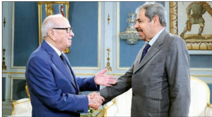
الرئيس التونسي الباجي قايد السبسي خلال لقائه عبدالعزیز البابطين