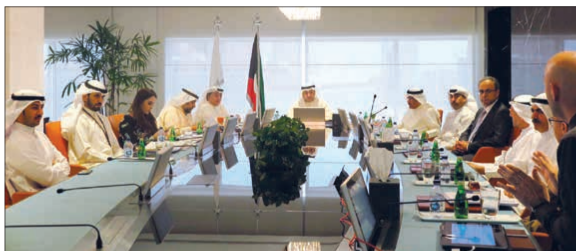
ياسر أبل مترئساً اجتماع مجلس إدارة بنك الائتمان بحضور صلاح المضف

أعلن المدير العام لبنك الائتمان صلاح المضف تكليف مجلس إدارة البنك بالتعاقد مع شركة عالمية متخصصة للمعاينة وتقييم الأضرار الناجمة عن حريق مبنى مشروع مقر البنك الجديد واتخاذ جميع الإجراءات اللازمة الموجودة في وثيقة التأمين. وأكد المضف في تصريح صحفي أمس عقب اجتماع مجلس إدارة البنك برئاسة وزير الدولة لشؤون الإسكان ووزير الدولة لشؤون الخدمات ياسر أبل حرص (الائتمان) على سلامة مشروع مقر البنك الجديد إنشائياً قبل استكمال المشروع.