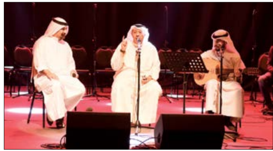
الملحن الكبير سليمان الملا في فقرته

التأليف الموسيقي إلى ثلاث مدارس، الأولى كلاسيكية قديمة تزعمها محمد عثمان، ثم كلاسيكية جديدة أسسها سيد درويش، ورومانتيكية قادها القصبي ومحمد عبد الوهاب، ورياض السنباطي وجدد مآها محمد الموجي والشريف والطويل، وقال: انقسمت الموسيقى المصرية بعد سيد درويش أي بعد العام 1930 لتتأثرين مستقتلين «تأثر الأغنية السينمائية» وتيار