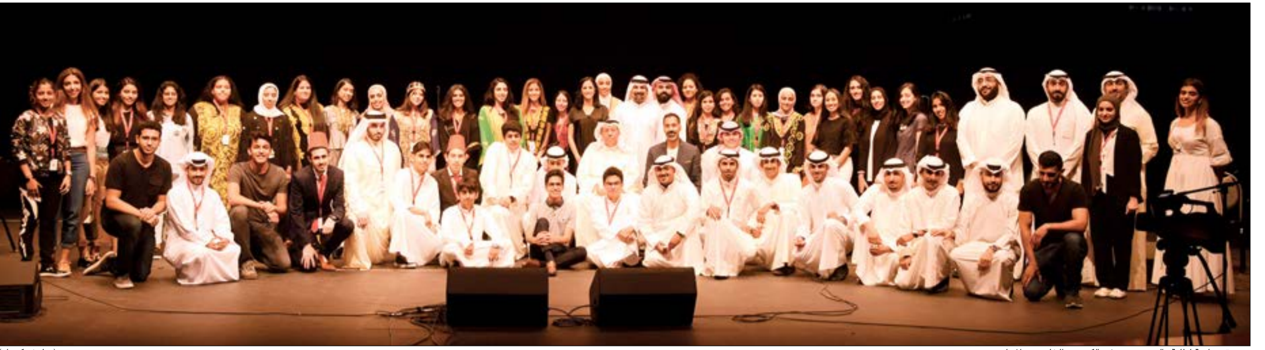
صورة جماعية لطلبة «البروتيجيز» في الكويت والخليج مع المحاضرين

البرنامج يواصل نجاحاته للعام السابع بمشاركة كبيرة