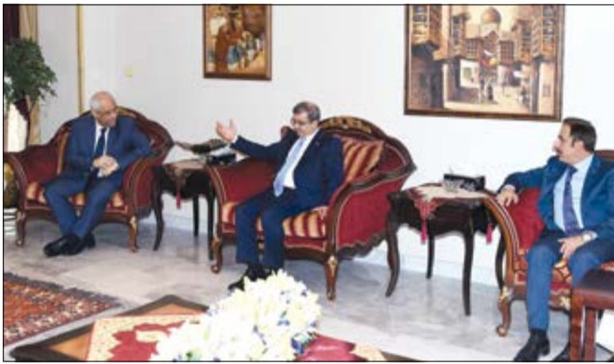
السفير العراقي علاء الهاشمي والسفير المصري ياسر عاطف ورئيس البعثة اللبنانية ماهر خير (رئيس كومار)

وضمان نجاحه بصورة كبيرة، مئثما مواقف الكويت تجاه العراق. وحول تحديد قيمة الخسائر في الموصل قال ان الخسائر المعنوية كبيرة جدا اكبر من الخسائر المادية والتي قدرت بالمليارات لإعادة هيكلة البناء والإعمار، واعتقد أن إعادة بناء الإنسان والثقة في المحافظات المنكوبة وخلق جو آمنى جماهيري تضمن عدم عودة الجماعات الإرهابية، وكشف الخليليا النائمة فيها يتطلب جهدا كبيرا ليس من قبل العراق فقط ولكن المنطقة بأكملها من أجل إيقاف دعم وتمويل هذه الجماعات الإرهابية.