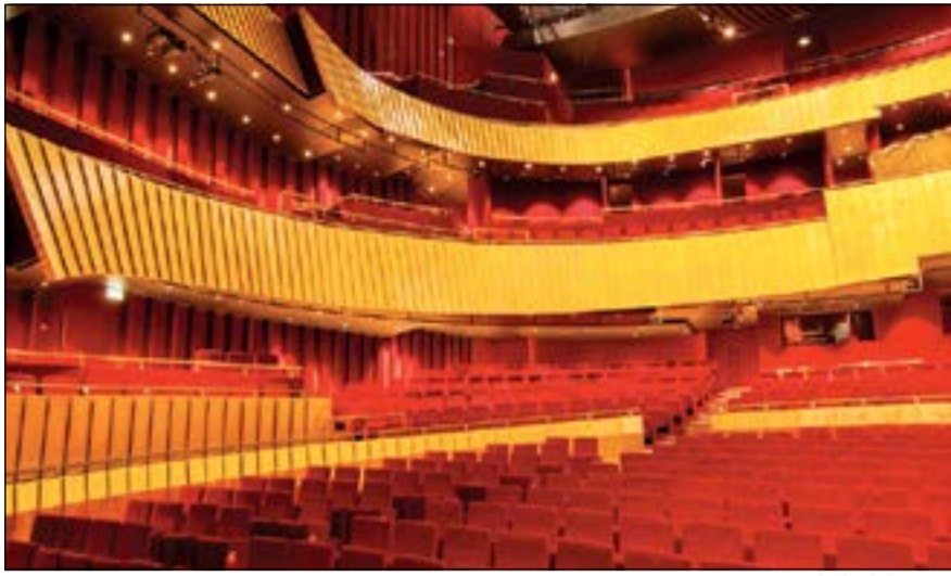
إحدى قاعات المركز