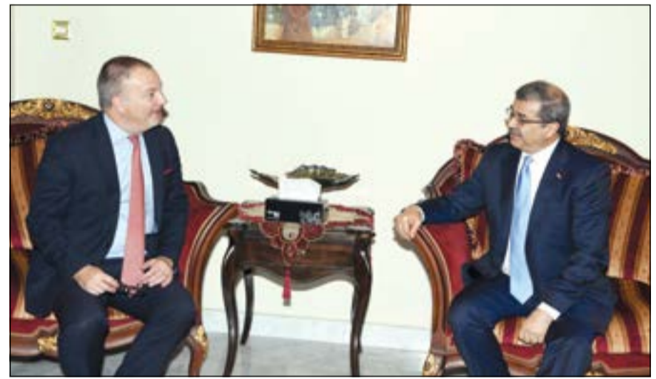
حديث بين السفير البريطاني ماثيو لودج مع السفير العراقي علاء الهاشمي

للمناحين لإعادة إعمار العراق قبل نهاية العام، لافتاً إلى أن الإعلان عن الموعد سيأتي