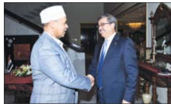
تهنئة من السفير الصومالي عبدالقادر أمين

السمو الأمير الشيخ صباح الأحمد أعلن عن استعداد الكويت لاستضافة مؤتمر