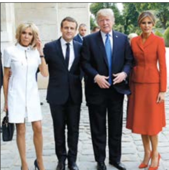
الرئيس الفرنسي إيمانويل ماكرون وقرينته يستقبلان نظيره الأميركي دونالد ترامب وقرينته في متحف انفالديس في باريس أمس