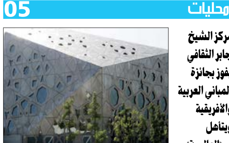
مركز الشيخ جابر الأحمد صرح ثقافي يدعو للفخر

المتطوعون الأغرار أثبتوا مهارة في فنون القتال المتلاحم والدفاع عن النفس 03