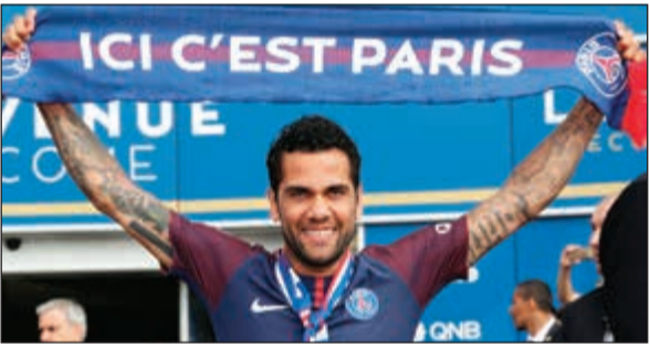
داني ألفيش يشعار بفرقة الجديد باريس سان جرمان

أعلن نادي باريس سان جرمان الفرنسي لكرة القدم أمس تعاقد مع الظهير الأيمن البرازيلي داني ألفيش قادما من يوفنتوس الإيطالي، في عقد يمتد حتى سنة 2019.