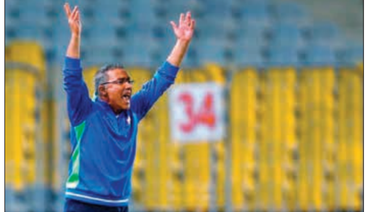
إيناسيو كشف نيته بالرحيل