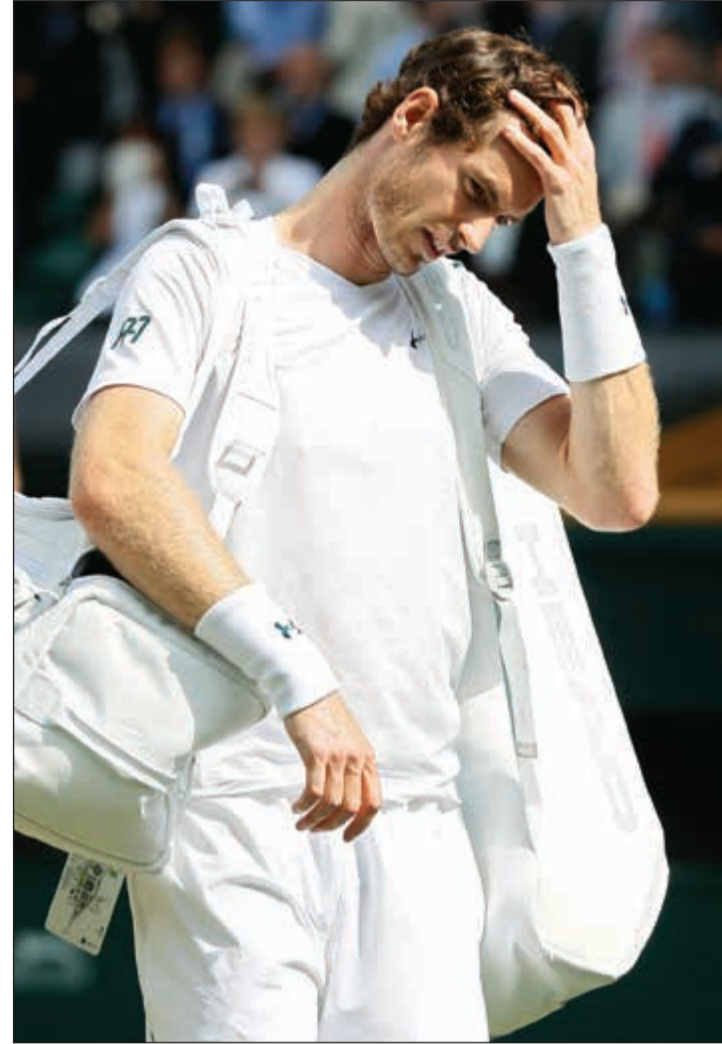
البريطاني أندى موراي يغادر «ويمبلدون» حزينا

فقد البريطاني أندى موراي المصنف أول لقبه في بطولة ويمبلدون الإنجليزية، ثالثة البطولات الأربع الكبرى في التنس، بخسارته في الدور ربع النهائي أمام الأميركي سام كويري.