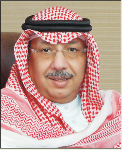
الشيخ محمد الجراح

شارك رئيس مجلس إدارة بنك الكويت الدولي واتحاد المصارف العربية الشيخ محمد الجراح في فعاليات «منتدى تعزيز الاستقرار المالي» الذي عقده الاتحاد مؤخراً بمدينة شرم الشيخ، وذلك بحضور نخبة من رؤساء البنوك العربية وشركات التأمين والتأجير التمويلي والبنوك الاستثمارية، إلى جانب مجموعة مختارة من المديرين والموظفين في البنوك المركزية العربية والجهات الإشرافية والرقابية.