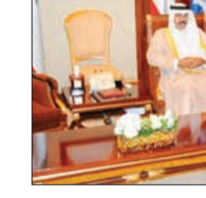
سمو ولي العهد الشيخ نواف الأحمد مستقبلاً الشيخ خالد الجراح

المشاركة كمحاضرين بالدورات الجمركية، مضيفاً من يرغب في التقدم فعليه اتباع التعاميم والشروط الخاصة للموظفين والتي تم تعميمها على جميع الموظفين بالإدارة، على أن تسلم الطلبات إلى «مكتب التدريب» بمقر الإدارة العامة للجمارك بالشويخ منطقة 3، ولفت الجلاوي إلى أن الأولوية ستكون لموظفي الجمرك كما في الدورات السابقة التي نظمتها الإدارة في أوقات مختلفة بالتعاون مع الهيئة العامة للتعليم التطبيقي