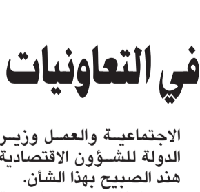
السفير ناصر الصبيح خلال مشاركته في الاجتماع

التحقيق في حالات الاشتباه والتحقيق عند عودة المقاتلين الإراهبيين الأجانب إلى مناطق النزاع وذلك تنفيذاً لقراري مجلس الأمن (2178) و(2253).