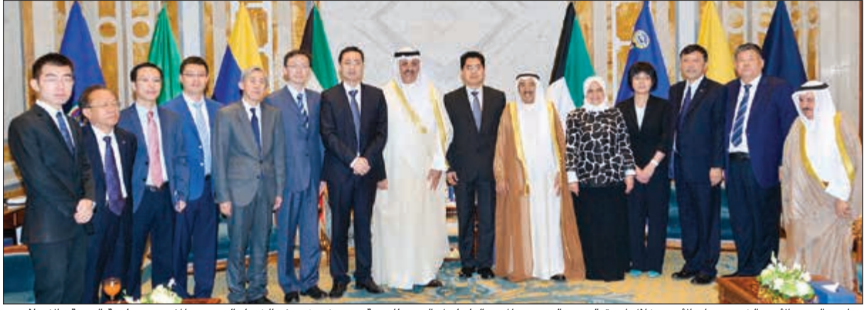
صاحب السمو الأمير الشيخ صباح الأحمد خلال استقباله مندو الصين للصينيين المفوض من لجنة التنمية والإصلاح

يسهل العمل فيها بصورة أفضل وأسرع. وأشار إلى قدرة الشركات الصينية الرائدة على تحسين البنية التحتية خاصة فيما يتعلق في بيئة الاتصالات وتقنية المعلومات فضلاً عن خبراتها التي تؤهلها لإعادة موازين القوة في صناعة التكنولوجيا العالمية خلال السنوات المقبلة. وفيما يتعلق بعقد تنفيذ شركة هواوي الصينية للمرحلة الثانية من مشروع الألياف الضوئية في الكويت بنحو 22 مليون دينار (نحو 72 مليون دولار)، أوضح القلاف أن العقد يغطي المناطق الجديدة وبعض المناطق القديمة من خلال تبديل الشبكية النحاسية للهواتف الأرضية والإنترنت بشبكة فايبر لادباب، ومن المتوقع أن ينتهي في منتصف عام 2018.