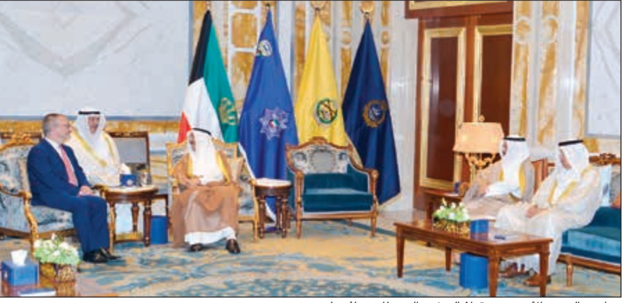
صاحب السمو الأمير مستقبلاً السفير البريطاني ماثيو لودج