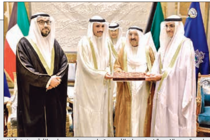
صاحب السمو الأمير الشيخ صباح الأحمد يتسلم من رئيس مجلس الأمة مرزوق الغانم ود. خليل عبدالله وأسامة الشاهين تقرير لجنة «مشروع الجواب على الخطاب الأميري».

الأمير التقى الغانم والجنة الرد: بذل المزيد من الجهود والعمل الدؤوب لتحقيق كل ما يتطلع إليه المواطنون من أهداف وظموحات