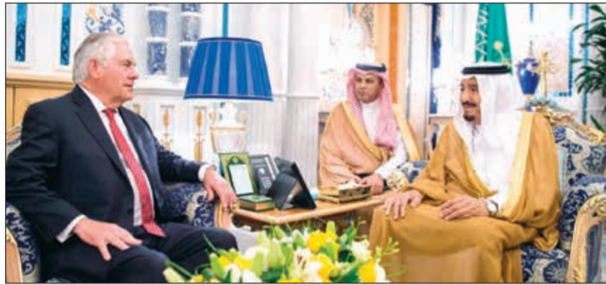
خادم الحرمين الشريفين الملك سلمان بن عبدالعزيز خلال استقباله وزير الخارجية الأميركي ريكس تيلرسون في جدة أمس