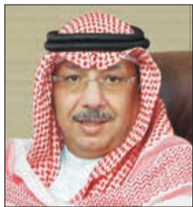
الشيخ محمد الجراح

«وربة» يسهم في إصدار صكوك بقيمة 400 مليون دولار لـ «مراس القابضة» 24