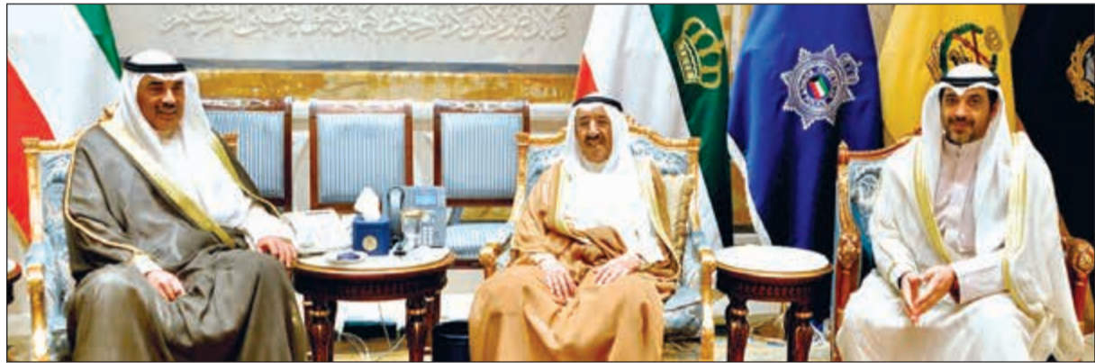
صاحب السمو الأمير الشيخ صباح الأحمد لدى استقباله الشيخ صباح الخالد والشيخ محمد العبدالله

قال وزير الخارجية الإماراتي الشيخ عبدالله بن زايد إن زيارة تيلرسون لن تحل الخلاف على الأرجح، لكنها ستؤجله فحسب. التفاصيل من 20