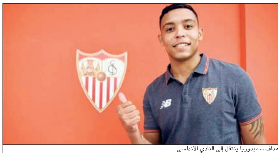
هداف سميدوريا ينتقل إلى النادي الأندلسي

لاعب منتخب إسبانيا (فيتولو) حتى عام 2022، ليقطع بذلك السبيل على أتلتيكو مدريد الذي كان يريد خطف اللاعب. وقال خوسيه كاسترو رئيس النادي: «في إشبيلية نحن نعمل بدلا من الكلام، ومددنا العقد لخمس سنوات مقبلة». وكان الأتليتي يسعى إلى دفع الشرط الجزائي المدرج في عقد فيتولو مع إشبيلية ثم إعارته إلى نادي لاس بالماس على أن يعيده مرة أخرى إلى صفوفه في يناير بعد رفع العقوبة عنه.