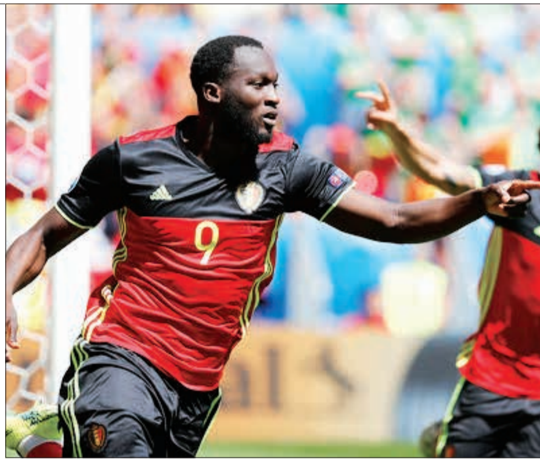
لوكاكو مع بلجيكا