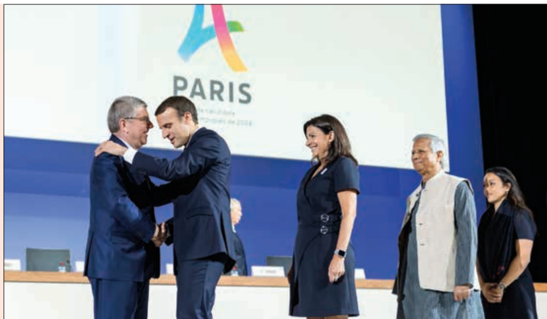
ماكرون يصافح باخ

أكد الرئيس الفرنسي إيمانويل ماكرون استعداد باريس لاستضافة دورة الألعاب الأولمبية الصيفية 2024 التي تتنافس عليها مع لوس أنجيليس الأميركية، وذلك في أعقاب عرض المدينتين لل ملف الترشيح أمام اللجنة الأولمبية الدولية في سويسرا. وقال ماكرون للصحافيين في لوزان «أنتيت إلى هنا لدعم الفريق والقول إلى أي حد الألعاب مهمة لبلادنا، فرنسا مستعدة، وهي تنتظر الألعاب»، مضيفًا «ثمة إرادة بالأمل والتقدم، وهذه الألعاب ستساهم في ذلك (...) خسرتنا سباق الترشيح ثلاث مرات، ولا نريد خسارة رابعة». وقدم مسؤولو ملفي ترشيح المدينتين عرضا أمام أعضاء اللجنة الأولمبية المجتمعين في لوزان، قبل أسابيع من اجتماع الجمعية العمومية للجنة في عاصمة البيرو ليما في سبتمبر المقبل، والذي سيتم خلاله اختيار المدينة المضيفة لدورة الألعاب المقبلة.