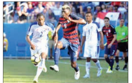
نجم المنتخب الأمريكي زارديس

بعد أن فقد المنتخب الأمريكي نقطتين ثميتين في مستهل مشواره ببطولة الكأس الذهبية لكرة القدم التي يستضيفها بسقوفه في فخ التعادل الإيجابي بهدف ثلثه أمام بنما في أولى مواجهات المجموعة الثانية بالبطولة، سيسعى فجر الخميس للتعويض وإسعاد الجماهير عندما يواجهون نظيرهم المتواضع مارتينيك.