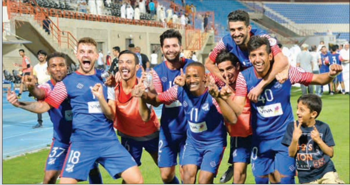
لاعبو التضامن تالقوا في الرسم الماضي