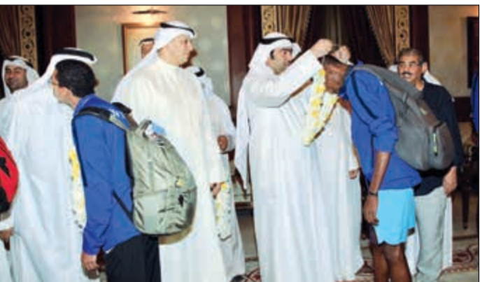
الروضان يقبل اللاعبين بأطواق الورد

أكد وزير التجارة والصناعة ووزير الدولة لشؤون الشباب بالوكالة خالد الروضان أمس حرص الدولة على رعاية المواهب الرياضية من أبناء الكويت وصقلها لتحقيق المزيد من الإنجازات. جاء ذلك في تصريح صحفي للوزير الروضان عقب استقباله منتخب الكويت لألعاب القوى بعد تحقيقه ميداليتين ذهبيتين وميدالية فضية في البطولة الآسيوية الـ 22 لفة الرجال التي أقيمت في الهند.