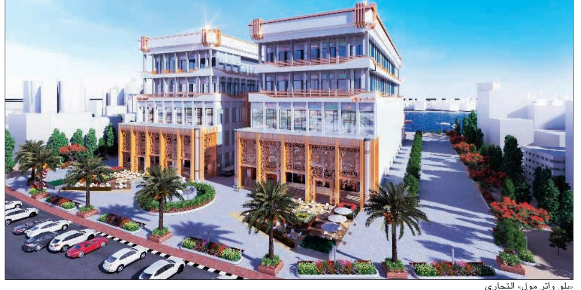
«بلو واتر مول» التجاري