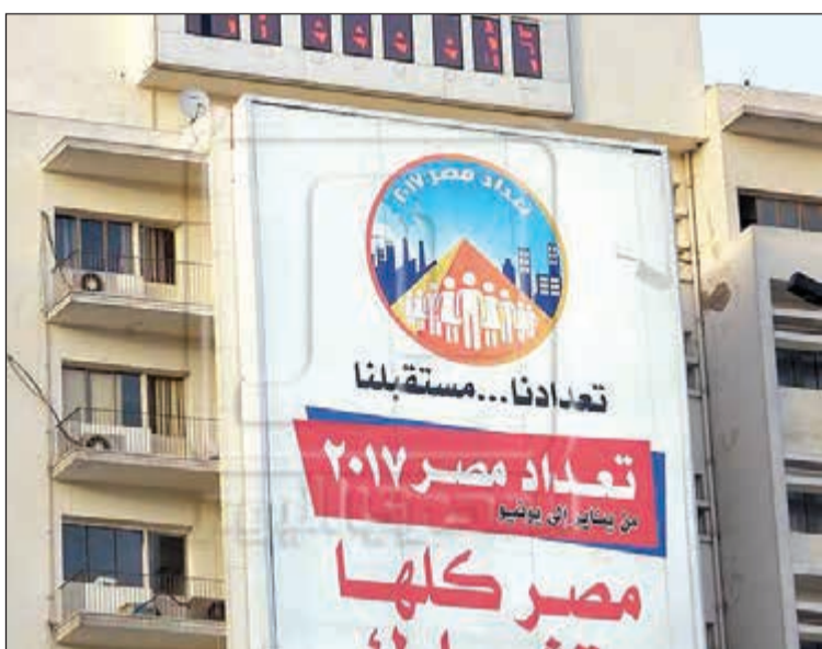
لافتة تحمل شعار التعداد السكاني للعام الجاري

القاهرة - أ.ش. - ذكر الجهاز المركزي للتعبئة العامة والإحصاء أن عدد سكان مصر بلغ حتى أمس، 93 مليوناً و332 ألف نسمة، مشيراً إلى ارتفاع عدد السكان من 72,8 مليون نسمة عام 2006 (آخر تعداد سكاني) إلى 92,1 مليون نسمة في بداية عام 2017 بزيادة 19,3 مليون نسمة عن بيانات آخر تعداد، منهم 51% ذكورا، و49% إناثا. وأوضح الإحصاء في بيان بمناسبة «اليوم العالمي للسكان»، والذي يوافق 11 يوليو من كل عام أن محافظة القاهرة تعتبر أكبر محافظات الجمهورية من حيث عدد السكان، بعدد سكان حوالي 9,6 ملايين نسمة، بينما جاءت محافظة جنوب سيناء أقل المحافظات عدداً في السكان حيث بلغ 173 ألف نسمة في الأول من يناير 2017. وأضاف أن المجتمع المصري يعتبر مجتمعاً شاباً، حيث تشكل الفئة العمرية (أقل من 15 سنة) ثلث السكان بنسبة 31,3%، بينما قدرت نسبة السكان من كبار السن (65 سنة فأكثر) 4,3% فقط في بداية عام 2017. ولفت البيان إلى أن نسبة سكان الحضر تبلغ حوالي 43% مقابل 57% سكان الريف، وبلغ معدل الإعرال العمرية الإجمالي للجمهورية 54,9% في يناير من السكان (عام 2016)، كما ارتفعت الكثافة السكانية من 71,5 نسمة/كجم عام 2006 إلى 92,4 نسمة/كجم عام 2017. وأشار إلى أن معدل المواليد ارتفع من 25,7 مولوداً حياً لكل ألف من السكان (عام 2006)، إلى 28,6 مولوداً حياً لكل ألف من السكان (عام 2016)، بزيادة 0,4%.