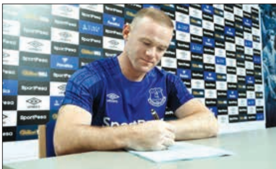
العودة إلى بيته القديم