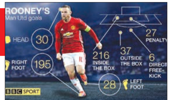
مسيرته مع يونايتد

سنتسلط الضوء على أهم المحطات البارزة في مشوار «الفتى الذهبي» من بدايته في إيفرتون مروراً بمان يونايتد