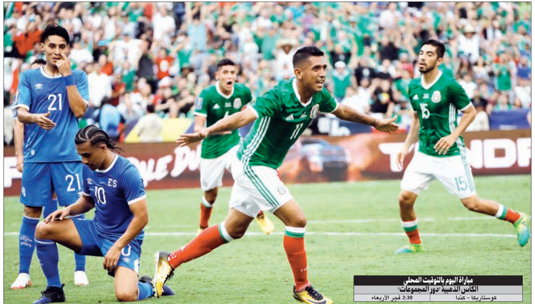
مباراة اليوم بالتوقيت المحلي

علق داني أليس لاعب يوفنتوس الإيطالي السابق على تصريحات رئيس نادي برشلونة بارتوميو والتي تحدث فيها عن أسباب رحيل النجم البرازيلي عن القلعة الكاتالونية في 2016. وقال بارتوميو إن أليس رحل عن البلوغرانا لأسباب شخصية، وليس بسبب الإدارة كما أعلن المدافع البرازيلي. ورد اللاعب على هذا التصريح عبر حسابه بموقع التواصل الاجتماعي تويتر بكلمة واحدة، وهي «كذب» دون تفاصيل. وكان أليس قد تحدث في حوار سابق، أنه رغب في الاستمرار مع برشلونة ولكن الإدارة تسببت في رحيله.