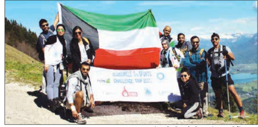
من «رحلة التحدي» لمرضى السكري إلى النمسا

في إطار التزامه المستمر نحو تعزيز الوعي الصحي بين جميع شرائح المجتمع، قام بنك الكويت الدولي مؤخرا برعاية مبادرة «رحلة التحدي» لمرضى السكري إلى النمسا والتي نظمتها فريق «بلو سيركل» التطوعي، وهو مجموعة غير ربحية تتألف من شباب من مرضى السكري في الكويت. وركزت المبادرة هذا العام على زيادة الوعي بمرض السكري من خلال إرسال مجموعة من الشباب الذين يعانون من السكري في رحلة إلى النمسا للمشاركة في عدد من النشاطات والتحديات الرياضية.