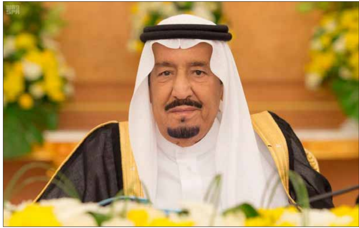
خادم الحرمين الشريفين الملك سلمان بن عبدالعزيز خلال ترؤسه جلسة مجلس الوزراء أمس (واس)

نتائج» خلال الجولة الخليجية التي يقوم بها تيلرسون، مضيفا «نحن على بعد أشهر مما نتصور أنه سيكون حلا فعليًا، وهذا الأمر غير مشجع». وقال هاموند إن تيلرسون سيستعرض سبل كسر جمود الموقف بعد رفض قطر لمطالب الدول الأربع المقاطعة. وتابع «زيارة السعودية وقطر تتعلق بفن الممكن»، لافتا إلى أن المطالب الثلاثة عشر «انتهت ولا تستحق العودة إليها بشكل مفضل. هناك أمور يمكن أن نتج من بينها». ويزور تيلرسون خلال جولته كلا من: الكويت وقطر والسعودية، مدسنا انخراط أميركا مباشرة لدعم جهود حل الأزمة الراهنة. وفي غضون ذلك، أعرب الرئيس التركي رجب طيب أردوغان عن تأييده لجهود الوساطة التي تبذلها الكويت من أجل حل الأزمة الخليجية. وقال أردوغان في تصريح صحافي نشرته صحيفة «حرييت ديلي نيوز» التركية على موقعها الإلكتروني مساء أمس الأول أنه سيقوم بجولة