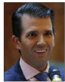
دونالد ترامب الابن

الجمهوريين من أعضاء مجلس الشيوخ تصريحات ترامب بلهجة حادة. حيث قال ليندزي غراهام السيناتور المخضرم عن ولاية ساوث كارولينا وعضو في لجنة القوات المسلحة بمجلس الشيوخ لقناة تلفزيون (إن.بي.سي) «ليست أغنى فكرة سمعتها في حياتي لكنها أقرب ما يكون إلى ذلك». وأضاف أن استعداد ترامب الواضح «للتسامح والسيان» قوى عزمه على إقرار تشريع يفرض عقوبات على روسيا. بدوره، قال جون ماكين النائب عن أريزونا والذي يرأس لجنة القوات المسلحة في مجلس الشيوخ لحظة تلفزيون (سي.بي.إس) «لم تكن هناك عقوبة.. فلاديمير بوتين.. أفلت من العقاب بمعنى الكلمة بعد أن حاول تغيير نتيجة.. انتخاباتنا». وأضاف «نعم.. حان الوقت للمضي قدما. لكن يجب أن يكون هناك ثمن يدفع». أما ماركو روبيو السيناتور عن ولاية فلوريدا، فكتب على تويتر