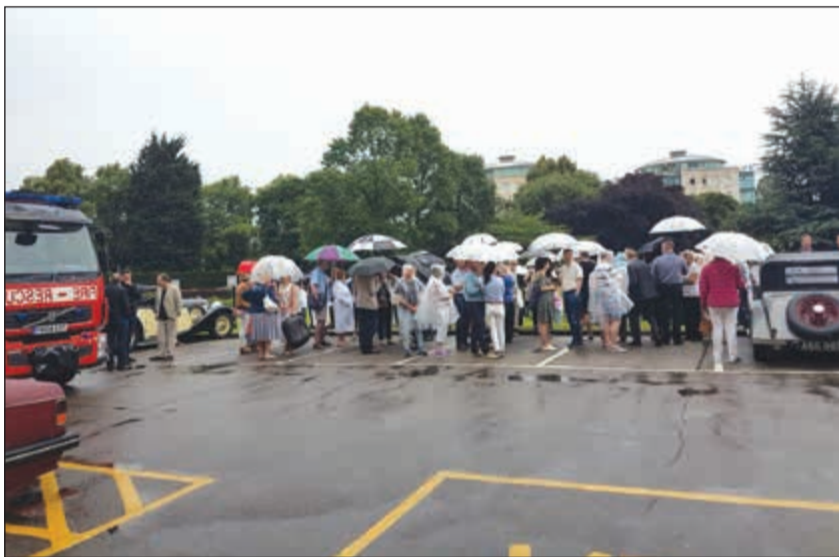
نزلاء فندق نبرسنيل يتجمعون في الحديقة بعد سماع صفارة الإنذار في غرفهم

أسس في 9:30 صباحا سمعت صفارة الإنذار، خرجت من غرفتي على وجه السرعة، وإذا بالنزلاء يركضون باتجاه السلالم دون استخدام المصاعد، وتم تجميع الناس في حديقة الفندق، وكان منعقدا في هذا الوقت مؤتمر ملاك الرزيرز بنتلي، وكان الجو في الخارج ممطرا، وتم توزيع لباس النايلون ولبس الناس الواقي المطري، ووصلت سيارات المطافي ودخلت فرقة فحصت المكان وبعد 10 دقائق سمح لنا بالعودة لغرفنا وكانت تجربة حية والجمهور واعيا متفهما طبيعة الإجراءات. تذكرت قومي كم نحتاج حتى نصل مستوى تعاونهم ورقبيتهم!