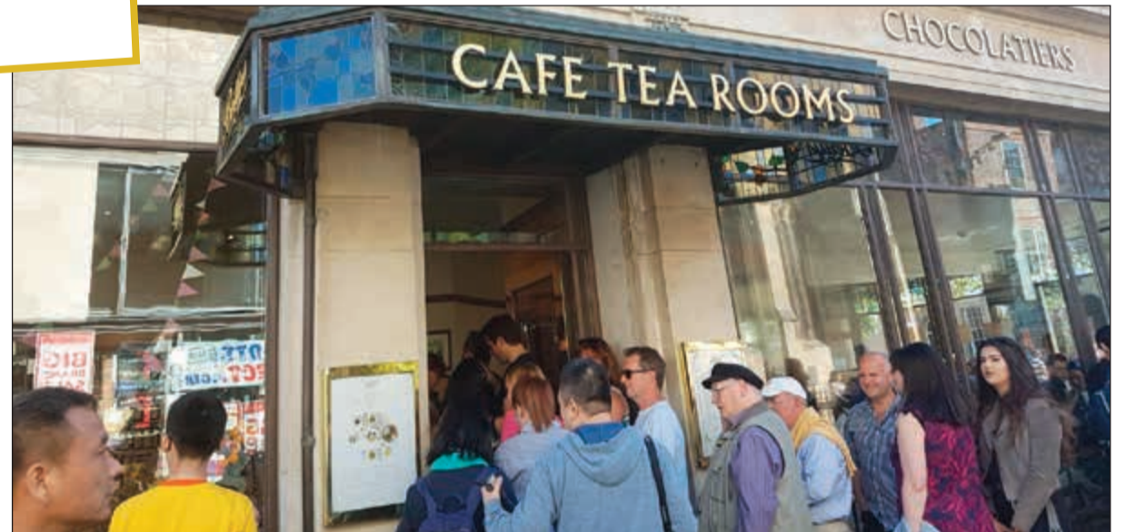
مخزن تاريخه 1919م