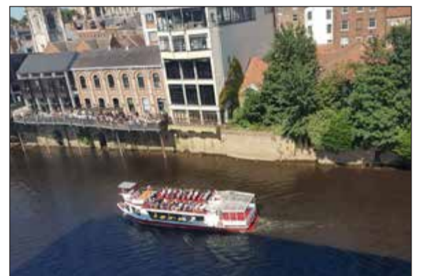
الإبحار في النهر تجربة لا تطوفك