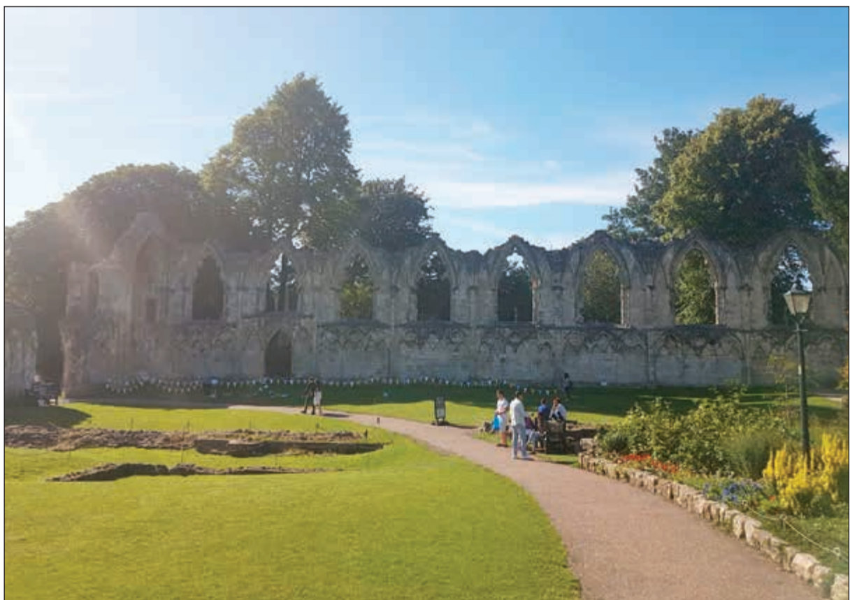
سور مدينة يورك القديمة وروعة المعمار الإنجليزي