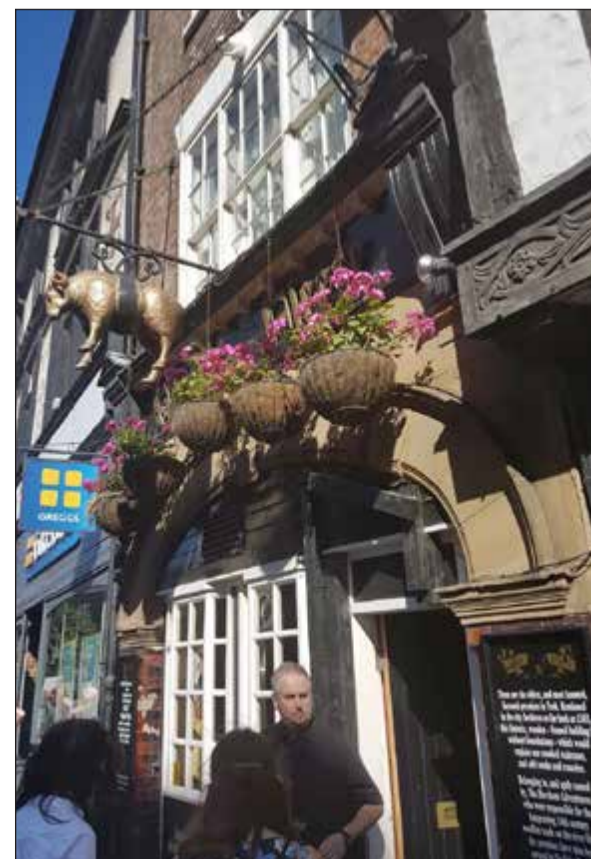
الورد المعلق..من يشتریک