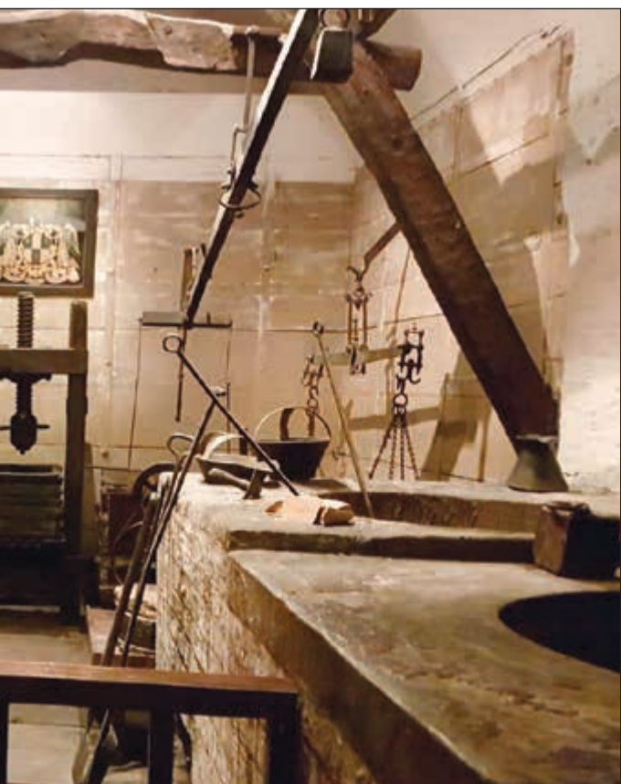
أحد مصانع الشمع القديمة في يورك