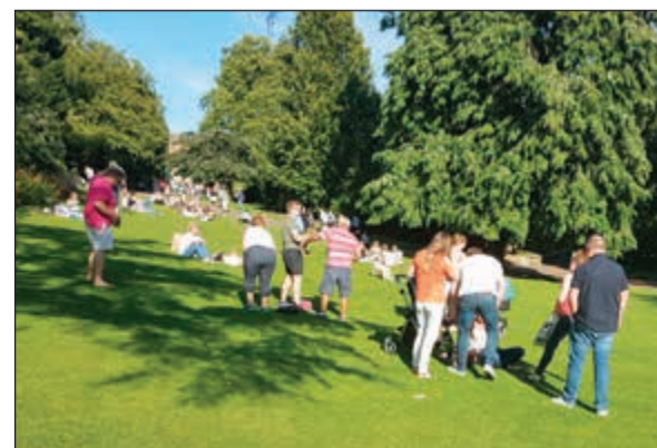
كشنة إنجليزية في الطبيعة.. مو بس احنا