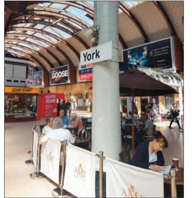
محطة يورك للقطارات