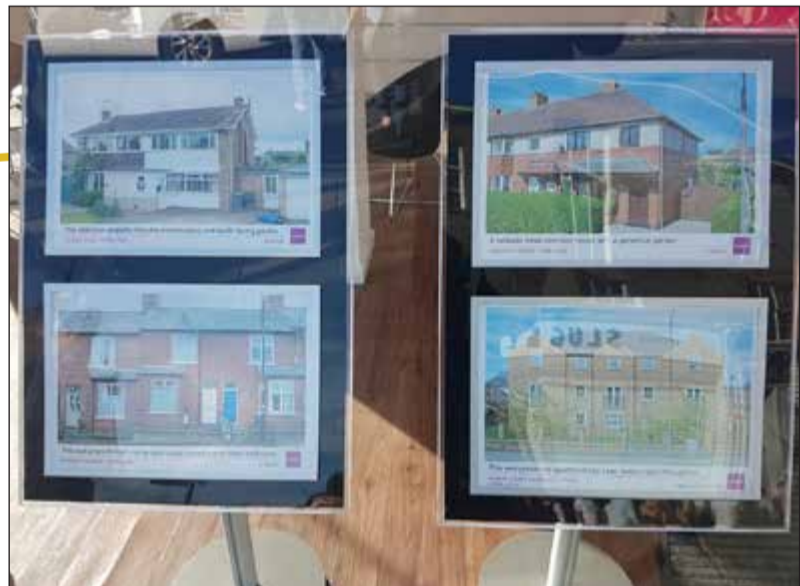
هذه اسعار البيوت في يورك