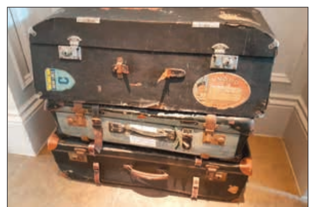
شمنطة قديمة يذكرها جيلنا الخضرم