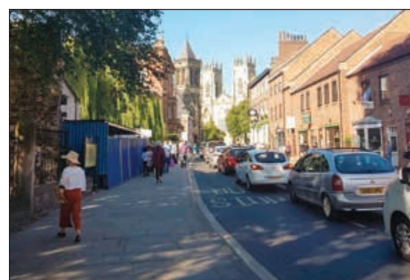
مبان جميلة في أفق يورك