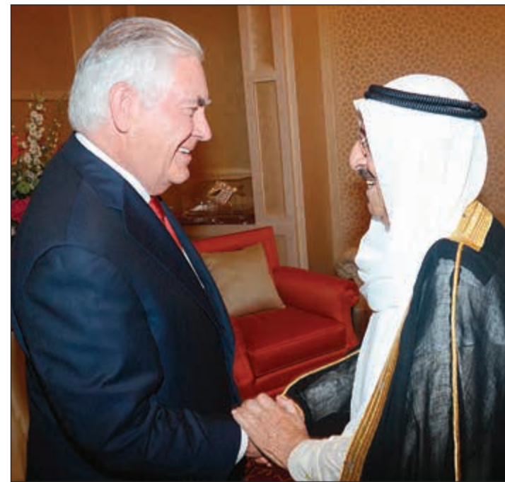
صاحب السمو الأمير الشيخ صباح الأحمد مصافحاً وزير الخارجية الأميركي ريكس تيلرسون

استعادت الوساطة الكويتية لحل الأزمة الخليجية زخمها مع استقبال صاحب السمو الأمير الشيخ صباح الأحمد وزير الخارجية الأميركي ريكس تيلرسون الذي وصل إلى الكويت مساء أمس وبداية محادثات مهمة لحلحلة الأزمة قبل أن ينتقل الوزير الأميركي إلى الدوحة اليوم الثلاثاء، وكان سموه قد استقبل مستشار الأمن القومي البريطاني مارك سيدويل لمناقشة الأزمة. هذا، وأعربت السعودية عن الشكر والتقدير لصاحب السمو الأمير على مساعي سموه وجهوده لحل الأزمة الخليجية. وذكرت وكالة الأنباء السعودية (واس) أن مجلس الوزراء السعودي أكد أن «الشعب القطري جزء أصيل من المنظومة الخليجية والعربية، وأن الإجراءات التي اتخذتها الدول الأربع موجهة للحكومة القطرية لتصحيح مسارها. وفي هذا الإطار، قال آر سي هاموند، كبير مستشاري تيلرسون: «أجرينا جولة من التبادلات والحوار ولم نحرك الكرة»، مضيفاً: «سوف نعمل مع الكويت ونرى ما إذا كان بإمكاننا مناقشة استراتيجية جديدة». إلى ذلك، أعلن الرئيس التركي رجب