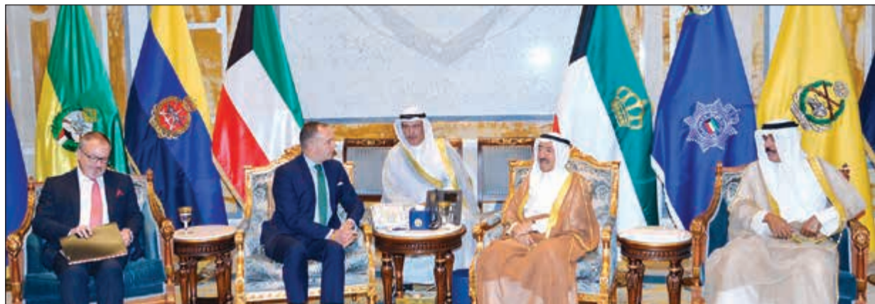
صاحب السمو الأمير الشيخ صباح الأحمد لدى استقباله مستشار الأمن القومي البريطاني مارك سيدويل بحضور سمو ولي العهد الشيخ نواف الأحمد والسفير البريطاني

وساطة تركية، مضيافاً: «لقد تحملت الكويت دور الوسيط، ونحن ندعم جهود الوساطة التي تبذلها، ما عنيه أن (الزيارة) ستكون للمساهمة في إعادة تأسيس الحوار بين مختلف الأطراف». والتقى أردوغان، في اسطنبول، الأحد، وزير الخارجية الأميركي ريكس تيلرسون.