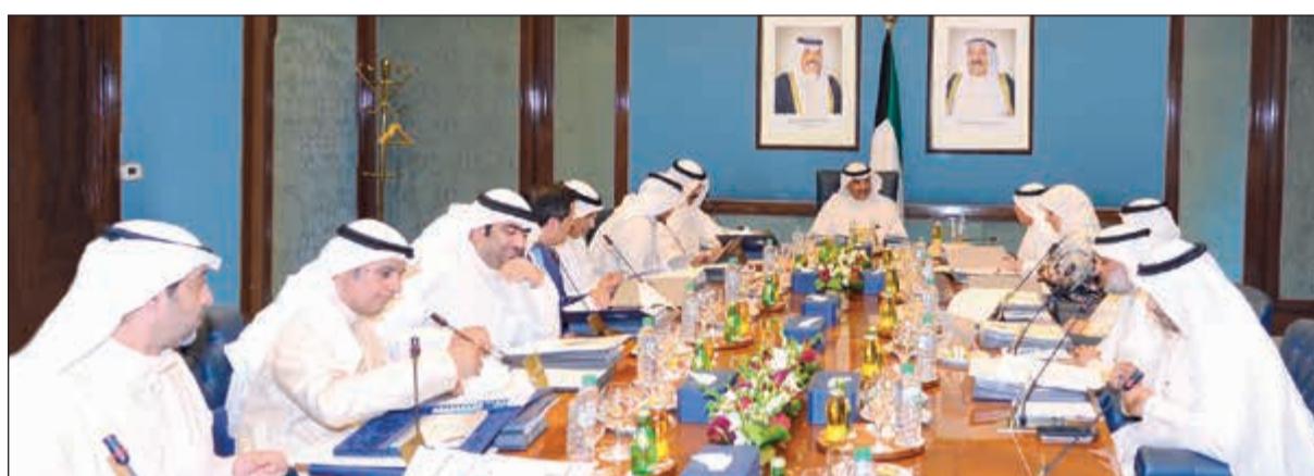
رئيس الوزراء بالإنيابة الشيخ صباح الخالد مترشداً اجتماع مجلس الوزراء أمس

للإصلاحات التي تعتمده بشكل رئيسي على تحقيق محورين من المحاور الستة هما زيادة تحصيل إيرادات الدولة المتأخرة لدى الوزارات