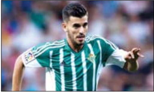
موهبة المتأدور وبيتيس

ظل داني سيابوس نجم ريال بيتيس وأفضل لاعب في يورو 2017 للشباب حديث الصحافة الإسبانية والعالمية خصوصا في ظل الصراع المثير بين ريال مدريد وبرشلونة. الصحافة الإسبانية أكدت ان الموهوب قال نعم لبطول دوري الأبطال والليغا واستجاب لضغوط فلورنتينو بيريز الذي أعطى 24 ساعة مهلة للاعب لقبول أو رفض الملكي، ومن المنتظر أن تتم الصفقة مقابل 15 مليون يورو.