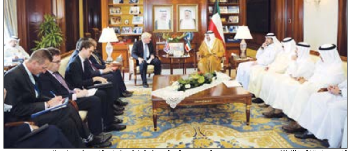
الشيخ صباح الخالد خلال لقائه بوريس جونسون بحضور الشيخ محمد العبدالله وخالد الجارالله والسفير الشيخ د. أحمد ناصر المحمد

الخالد استقبله وأثنى على دعم المملكة المتحدة لمساعي صاحب السمو