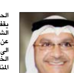
الشيخ فهد السالم

لندن - كونا: قال رئيس الجهاز الفني لبرنامج التخصيص الشيخ فهد السالم الصباح ان الحكومة ماضية في تنفيذ برنامج التخصيص كهدف استراتيجي في المرحلة المقبلة لتوفير آلاف الفرص الوظيفية لأبنائها. وأضاف في تصريح على هامش زيارته الى لندن ان «القادمين لسوق العمل خلال العامين القادمين سيصلون الى عشرات الآلاف سنويا ومن الصعب على الحكومة تعيّنهم جميعا في القطاع العام». وأشار الى ان هناك تخوفا وقلقا لدى بعض الشباب من العمل في القطاع الخاص لعدم احساسهم بالأمان الوظيفي رغم وجود تشريعات تحفظ حقوقهم من تسفح المستثمر علاوة على ان القطاع الخاص سيمكنهم من الإبداع وتطوير قدراتهم. وأكد الشيخ فهد السالم