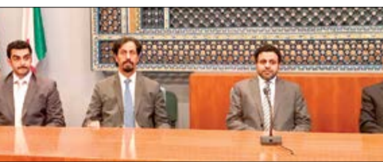
محمد الجبري والسفير الشيخ علي الخالد وعبد الله رضوان خلال زيارة جامع روما الكبير

روما كونا: أكد وزير الأوقاف والشؤون الإسلامية ووزير الدولة لشؤون البلدية محمد الجبري أهمية دور المركز الثقافي الإسلامي وجامع روما الكبير ومهمته في التعريف بحقيقة الإسلام وتعزيز الحوار بين الثقافات والأديان. جاء ذلك في زيارة قام بها الوزير الجبري برفقة سفيرنا في إيطاليا الشيخ علي الخالد إلى المركز الثقافي الإسلامي وجامع روما الذي يعد أكبر المساجد في أوروبا حيث أدوا الصلاة وذلك على هامش ترؤسه وفد الكويت في المؤتمر العام لمنظمة الأغذية والزراعة المتعددة في روما هذا الأسبوع. وأشاد الجبري بجهود المركز الثقافي الإسلامي ورسالته المهمة في رفع الحواجز بين المسلمين والمجتمع الإيطالي وفي التصدي للنظر وتصحيح المفاهيم المغلوطة عن الدين الحنيف والمركز عن الحضاري للإسلام من أجل دحض حملات الكراهية والتشويه المغرضة لصورة الإسلام والمسلمين. وأكد في هذا السياق دعم