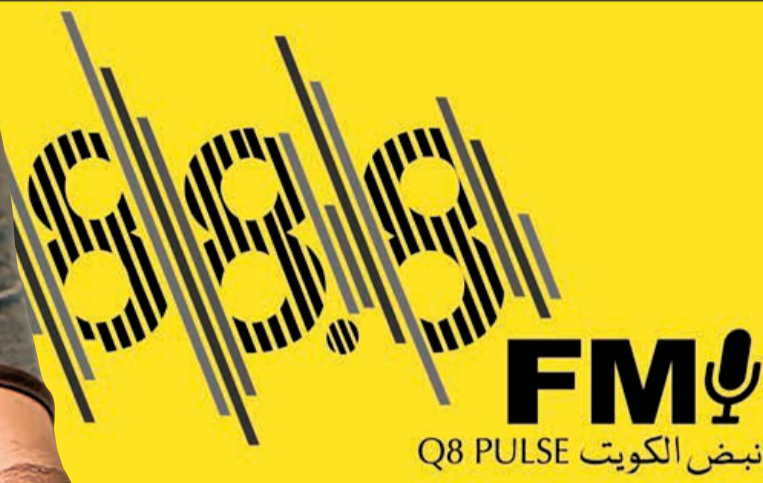
شعار إذاعة «نبض الكويت»