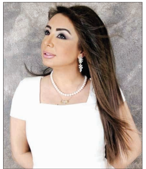
النجمة شيماء علي

وأضافت: «ونعم بالدول، وليكون على بالك إذا سميتوا ولدكم على اسم دولة معينة راح تنتقل هذه الدولة بالولد حتى المات.. حرام اللي يصير». جدير بالذكر أن شيماء شاركت خلال السباق الرمضاني لهذا العام بالمسلسل الكوميدي «رمانة»، إلى جانب الفنانة القديرة حياة الفهد، وعدد من نجوم الدراما الكويتية والخليجية.