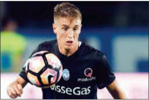
ظهير أيمن اتلانتا

ذكرت تقارير صحافية إيطالية أن نادي ميلان اقترح كثيرا من إغلاق صفقته السابعة هذا الصيف. وقالت صحيفة «لا غازيتا ديلو سبورت» الإيطالية، إن اللومباردي توصل إلى اتفاق مع اتلانتا لانتقال أندريا كونتي إلى الروسونيري مقابل 24 مليون يورو. وأوضحت بعض التقارير أن اللاعب قد يخضع للفحوصات الطبية تمهيدا لانضمامه إلى ميلان غدا الخميس، على أن ينضم لزملائه الجدد 11 يوليو المقبل، لبدء الاستعداد للموسم المقبل. وأبرم النادي 6 صفقات حتى الآن آخرها كانت التركي هاكان تشالهان أوغلو من بايرليركوزن الألماني. في المقابل اقترح نادي طرابزون سبور التركي من الحصول على خدمات كوتشكا لاعب ميلان. وأوضحت التقارير الواردة من إيطاليا أن كوتشكا سافر إلى تركيا لحسم الصفقة مقابل 6 ملايين يورو ولكي يرحل عن صفوف الروسونيري.