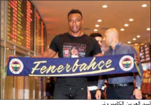
أسد العرين الكامبروني

أعلن نادي فناربخشة التركي إتمام تعاقد مع الكامبروني كاميني حارس مرمى فريق ملقة الإسباني بشكل رسمي خلال فترة الانتقالات الحالية. وذكر موقع الكالتشيو ميركاتو أن كاميني نجح في اجتياز الفحص الطبي قبل إتمام عملية التوقيع بشكل رسمي مع النادي. وانضم كاميني 33 عاما، لصفوف ملقة منذ 2012 قادما من إسبانيول، وبعد موسم لم يحظ فيه بفرصة المشاركة بشكل أساسي، بات الكامبروني الحارس الأساسي للفريق الأندلسي منذ موسم (2014-2015) بعد رحيل الأرجنتيني وبلي كاباييرو لمان سيني الإنجليزي. وخاض اللاعب الأسمر 113 مباراة مع ملقة في الليغا وسبعا في كأس الملك وواحدة في دوري الأبطال.. وفي 15 أبريل الماضي، تحديدا في الجولة 32 لليغا، دخل كاميني تاريخ الكرة في إسبانيا بعدما بات الحارس الأجنبي الأكثر خوضا للمباريات في الدوري برصيد 329 مباراة.