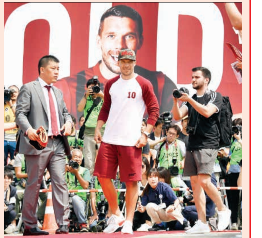
استقبال رائع للاماني

رحب مئات من جماهير كرة القدم بلوكاس بودولسكي مهاجم المنتخب الألماني السابق فور وصوله لليابان، وذلك قبل أن يبدأ مسيرته مع فريق فيسبل كوبي لكرة القدم. ووصل بودولسكي مرتديا قبعة مكتوبا على مقدمتها اسم الشهرة الخاص به «بولدي» باللغة اليابانية قبل أن يوقع على الأوتوغرافات والتقاط صور مع معجبيه والأطفال.