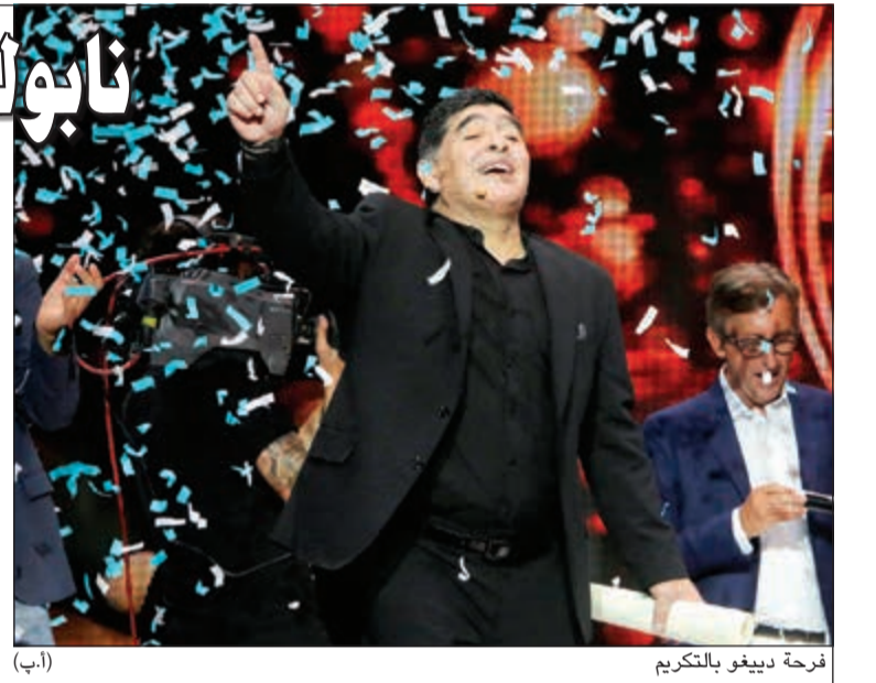
فرحة دييغو بالتركي

كتب أسطورة كرة القدم الأرجنتينية دييغو مارادونا بعد حصوله على المواطنة الفخرية من مدينة نابولي خلال تكريمه من المدينة التي كان يلعب لفريقها وقاده للانتصارات في الثمانينات والتسعينات، عبر موقع التواصل الاجتماعي على الإنترنت (فيسبوك): «أصبحت مواطنا في نابولي». واحتفل لويجي دي ماجيستيريس عمدة نابولي وزملاء النجم الأرجنتيني السابقين في الفريق ولاعيون محليون آخرون بدييغو في ساحة «بيازا ديل بليبيسيو» أمام ما يقرب من عشرة آلاف مشجع. بعد ذلك، امتدت الاحتفالات في الطرق واعتلى مارادونا، الذي كانت روحه عالية، سيارة خارج الفندق الذي يقيم به وقاد الجماهير بالهتاف للفريق. وقال: «من لا يهتف فإنه من جماهير يوفنتوس». وتابع مارادونا: ساكون مواطنا من نابولي وأشكر مجلس المدينة على ذلك، لكنني كنت مواطنا من المدينة