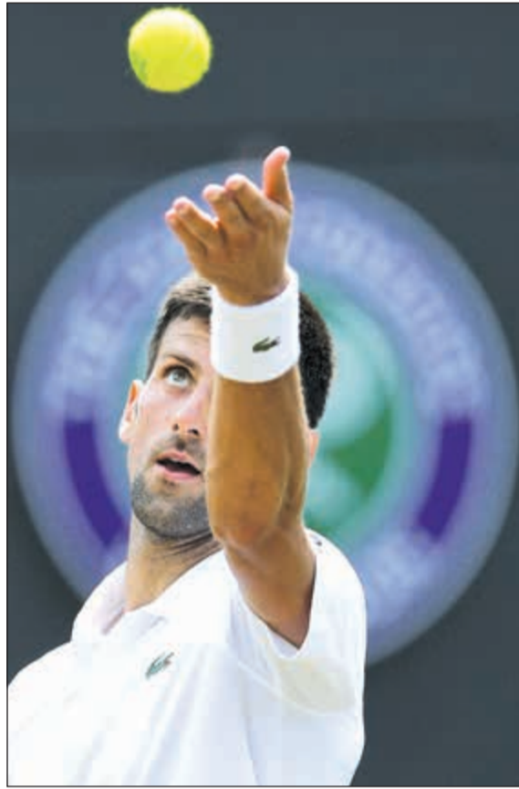
الصربي نوفاك ديوكوفيتش يرسل الكرة نحو التشيكي آدم بافلاسيك

على اللاتفية اناستازيا سيفاستوفا الثامنة عشرة 0-6 و6-4. وتأهلت الرومانية سيمونا هاليب المصنفة ثمانية إلى الدور الثالث بفوزها على البرازيلية بياتريز حداد مايا 5-7 و3-6. وتواجه هاليب في الدور الثالث الصينية بينغ شواي الفائزة على الإسبانية كارلا سواريز نافارو الخامسة والعشرين 2-6 و2-6.