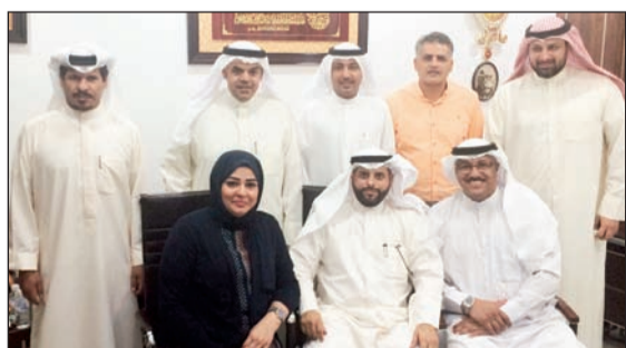
أعضاء مجلس الإدارة