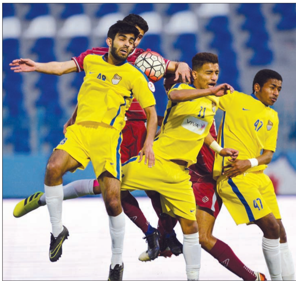
لاعب الساحل بحاجة للروح العالية في الموسم الجديد (الأزرق.كوم)

مختص في اللياقة البدنية ليخضما إلى طاقم التدريب الخاص بالفريق الكروي.