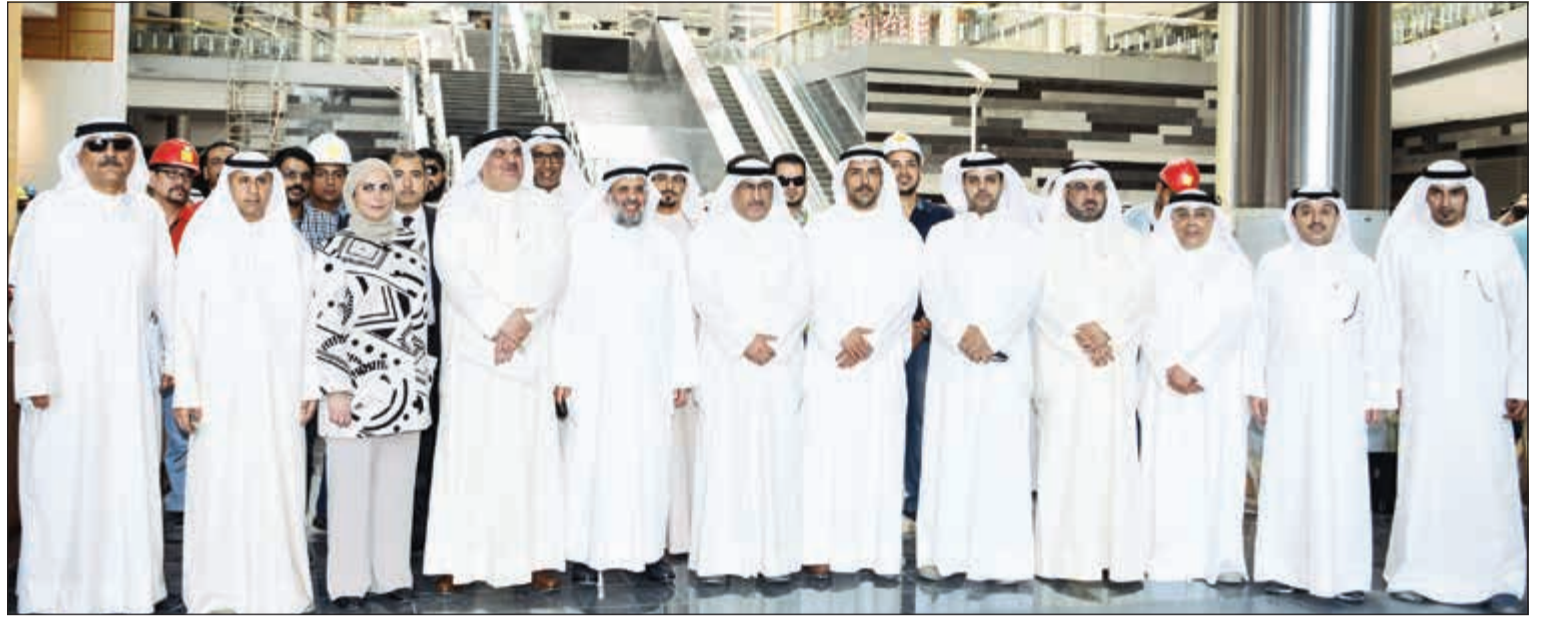
م. عبدالرحمن المطوع ود. محمد الفارس وعدد من قيادات «التربية» والأشغال، خلال زيارتهم إلى المبنى الجديد لديوان وزارة التربية