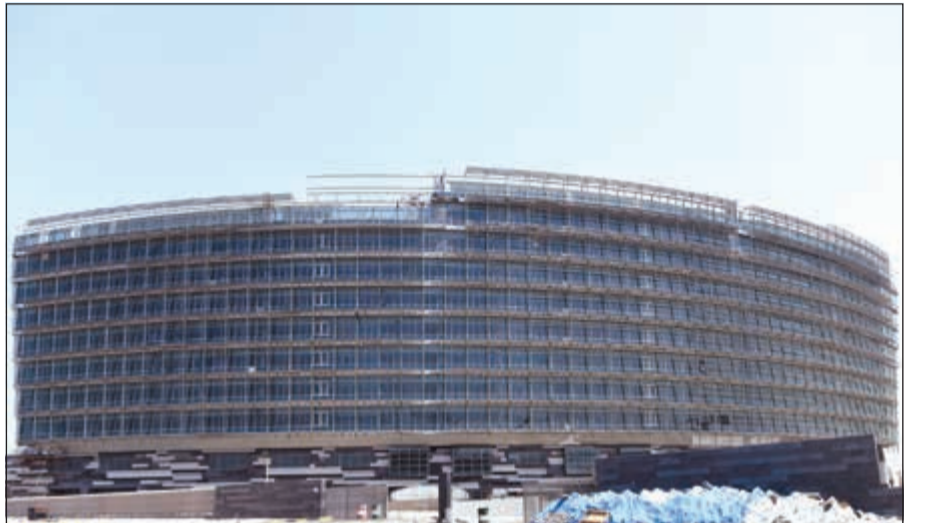
المبنى الجديد لديوان وزارة التربية في المرحلة الأخيرة للإنجاز

وقال الفارس إن مسؤولياتنا كوزارة التربية نطلع على المشروع ومراحل إنجازه وخطة سير الأعمال إلى الهدف المنشود ونحن نضع يدنا بيد وزارة الأشغال ونؤكد ضرورة أن يقوم المقاول بدوره حسب الجدول الزمني المحدد لانتهاء المشروع، لكن تبريراته عن